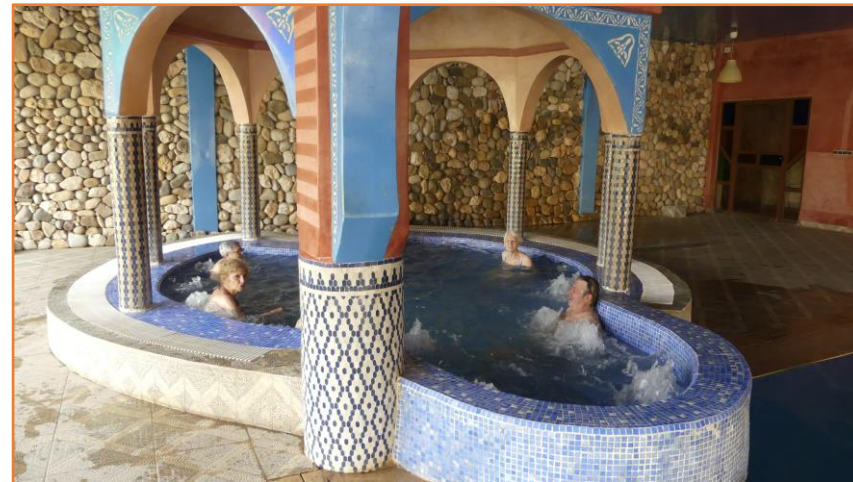
Jacuzzi (inclus dans le séjour)