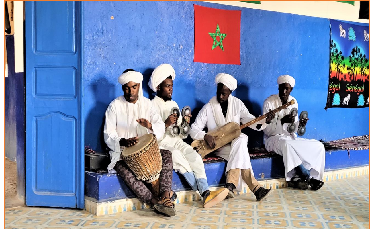
Musiciens GNAOUAS à KHAMLIA

permettent d'amener l'eau des dunes de sable, pour alimenter cette oasis, utilisée comme jardin collectif, pour les habitants de MERZOUGA).