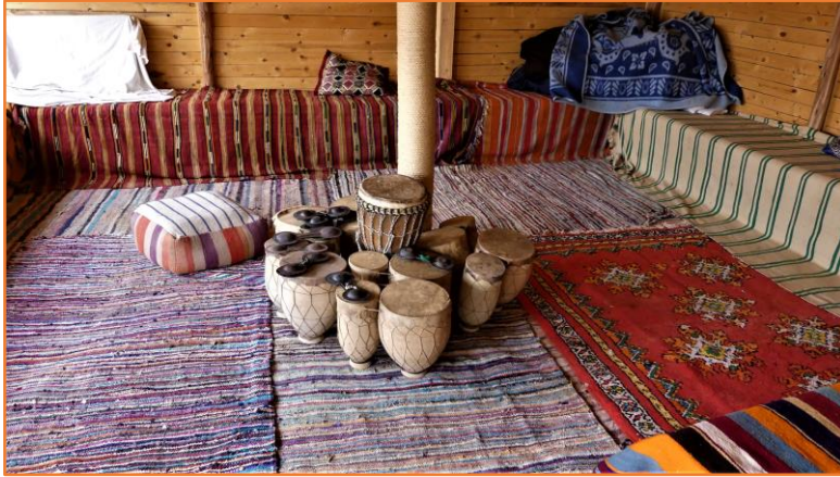
Veillées nocturnes berbères