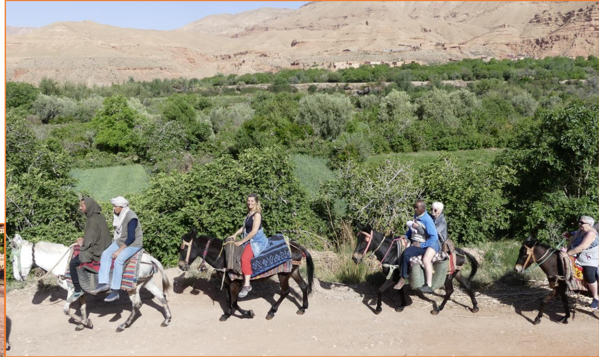
Rando dans la vallée des roses

Le déjeuner se prendra à midi dans une véritable Kasbah authentique, après avoir visité la superbe Kasbah d'AMRHIDIL de SKOURA. Votre après midi sera consacrée à la visite du musée cinématographique des studios ATLAS et à la découverte de la Kasbah de TAOURIRT à OUARZAZATE.