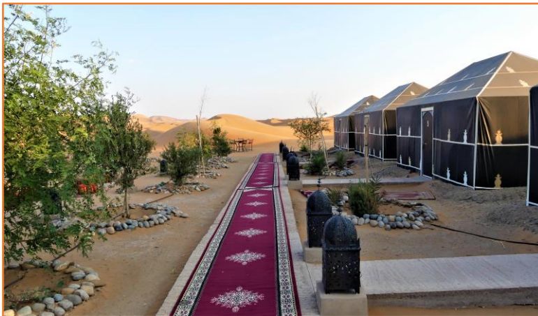
Bivouac VIP dans les dunes

Comment venir dans le désert Saharien et ne pas y bivouaquer...? Au moins une nuit ..., afin de pouvoir admirer un coucher de soleil entre les dunes, dans un ciel si pur, contenant une myriade d'étoiles sur la voute céleste, profiter d'une soirée berbère, avec un repas saharien et « écouter » le grand silence du désert, après une veillée musicale... ? Les plus courageux se lèveront le lendemain matin afin d'assister cette fois, au lever du soleil, avant de déjeuner dans les dunes.