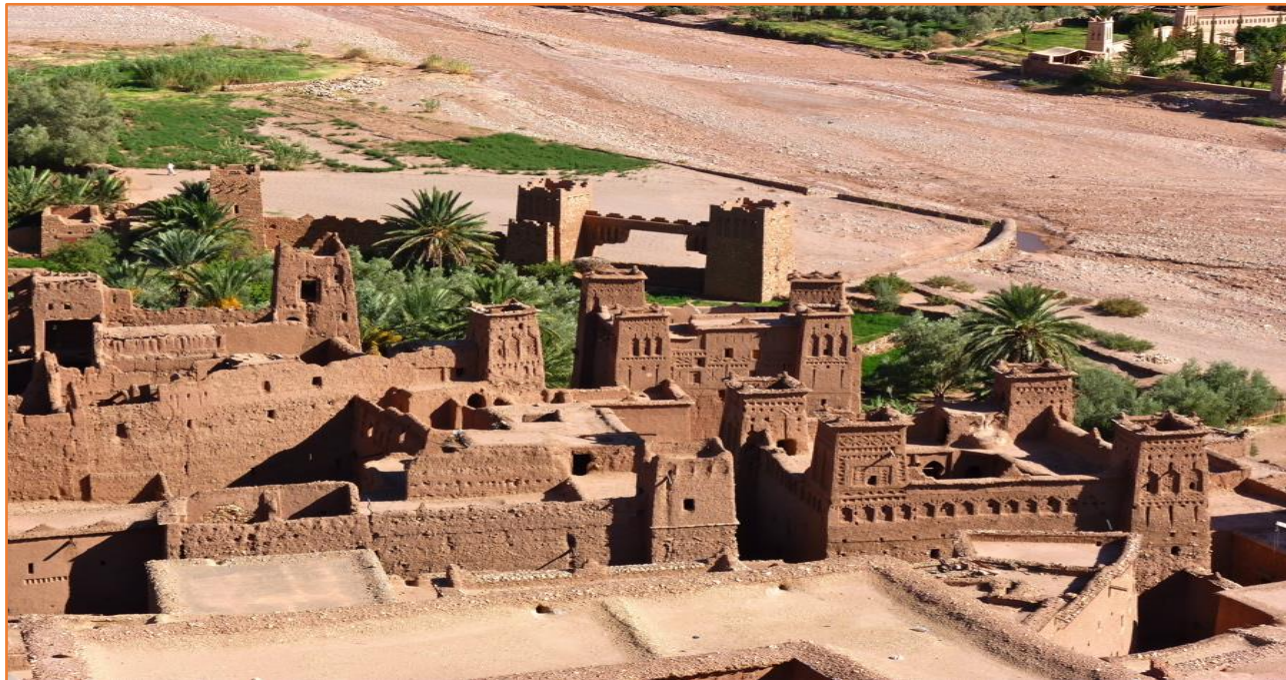
Kasbah AIT BEN HADDOU

A 9 heures, après le petit déjeuner, le minibus ALSEO emmène les accompagnants dans la vallée des roses, à la rencontre des quadeurs, avec qui vous enfourcherez des mulets pour entreprendre une randonnée magnifique depuis le petit village de TOURBIST, jusqu'à celui de HDIDA, dans des espaces sauvages, le long de l'oued M'GOUN. La rando terminée, vous vous rendez à EL KELÂAT M'GOUNA, capitale de la vallée des roses, pour une visite initiatique dans une distillerie de pétales de roses et ses multiples applications cosmétiques.