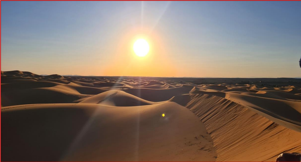
Coucher de soleil dans le désert

Après le repas vous empruntez une piste roulante, avant de poursuivre le lit de l'oued ALNIF qui, dans un paysage désertique, vous conduit à la ville du même nom « ALNIF ».