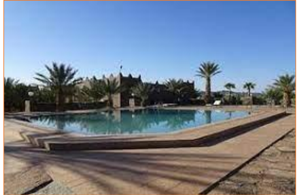
Hotel METEORITES D'ALNIF