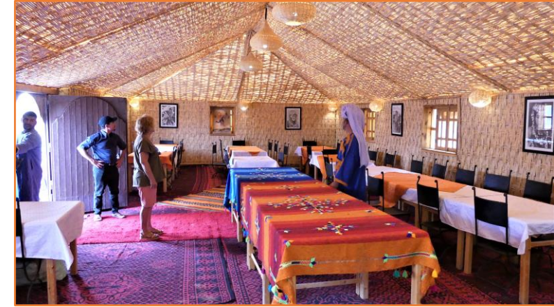
Repas à l'intérieur ou l'extérieur, selon les vents

Comment venir dans le désert Saharien et ne pas y bivouaquer...? Au moins une nuit ..., afin de pouvoir admirer un coucher de soleil entre les dunes, dans un ciel si pur, contenant une myriade d'étoiles sur la voute céleste, profiter d'une soirée berbère, avec un repas saharien et « écouter » le grand silence du désert, après une veillée musicale... ? Les plus courageux se lèveront le lendemain matin afin d'assister cette fois, au lever du soleil, avant de déjeuner dans les dunes.