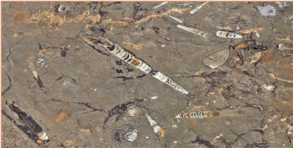
Marbres de fossiles visibles dans les carrières de MERZOUGA.

8 h 00 : Après le petit déjeuner, sous la conduite du guide, le groupe entreprend le départ de la première étape du séjour « SABLES ET MONTAGNES » qui débute par une adaptation à la conduite des Quads dans les hautes dunes de MERZOUGA. Le village de Merzouga se situe à 660 m d'altitude. Vous éprouverez maintenant le bonheur de parcourir les belles dunes ocres de l'erg CHEBBI (les plus belles et plus hautes du Maroc) qui, avec ses 160 m de hauteur (par rapport à MERZOUGA), revendique le point altimétrique le plus élevé des dunes Saharienne Marocaine. Vous confondrez le vallonement des ergs, et leurs ondulations harmonieuses, avec les courbes douces de vagues marines océaniques. L'étape se poursuivra ensuite en utilisant des pistes, jusqu'aux carrières de marbres fossilisées, fossiles qui témoignent du passé marin du Sahara voici 65 millions d'années.... Vous serez impressionnés par l'énormité des blocs de marbre de fossiles extraits du sol. Dans l'immensité des regs Sahariens, vous emprunterez ensuite un itinéraire d'où les pistes commencent à disparaître pour laisser place à de la « navigation et aux savoirs de notre guide », en recherche d'une petite oasis perdue et inhabitée, nommée SAFSAF, sise à 35 Km de la frontière Algérienne. Chemin faisant vous doublerez une autre petite oasis perdue mais néanmoins charmante, celle de LAOUINA.