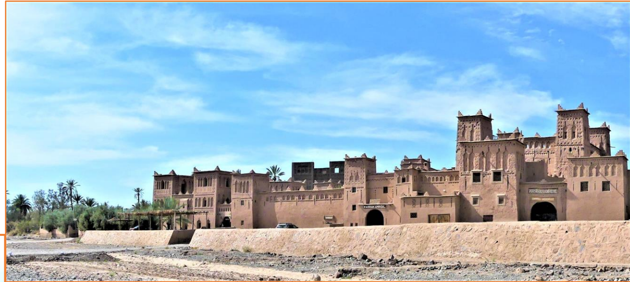
Kasbah AMRIDHIL de SKOURA

Le djebel SAGHRO, vous réserve le spectacle de paysages minéraux sauvages et déchiquetés, aux couleurs variant avec la luminosité solaire. Ca et là, les nomades venant faire paître leurs troupeaux, vous invitent chaleureusement à venir prendre un thé à la menthe sous leurs campements. Aux pieds du djebel SAGHRO, vous parvenez à IKNOUEN, village capitale de la puissante tribu Marocaine des AÏT ATTA. Vous y prenez votre repas de midi dans un petit restaurant local. Après le repas, vous vous dirigez vers BOUMALNE DE DADES où, un bain dans la piscine de l'hôtel ou vous ferez étape, ne sera certainement pas de refus...! Vous prenez votre repas du soir au Riad pour une bonne nuit de repos.