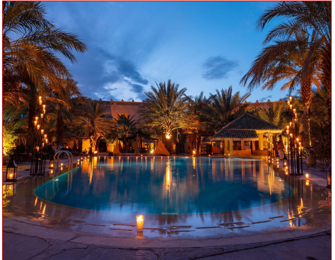
Hotel kasbah XALUCA à ERFOUD

23 h 59 - Accueil des participants en provenance de Marseille, à l'aéroport d'ERRACHIDIA, par l'équipe d'encadrement d'ALSEO, pour un transfert, en direction du kasbah hotel d'ERFOUD (5 étoiles), https://xaluca.com/fr/kasbahhotelxaluca où vous passerez la nuit.