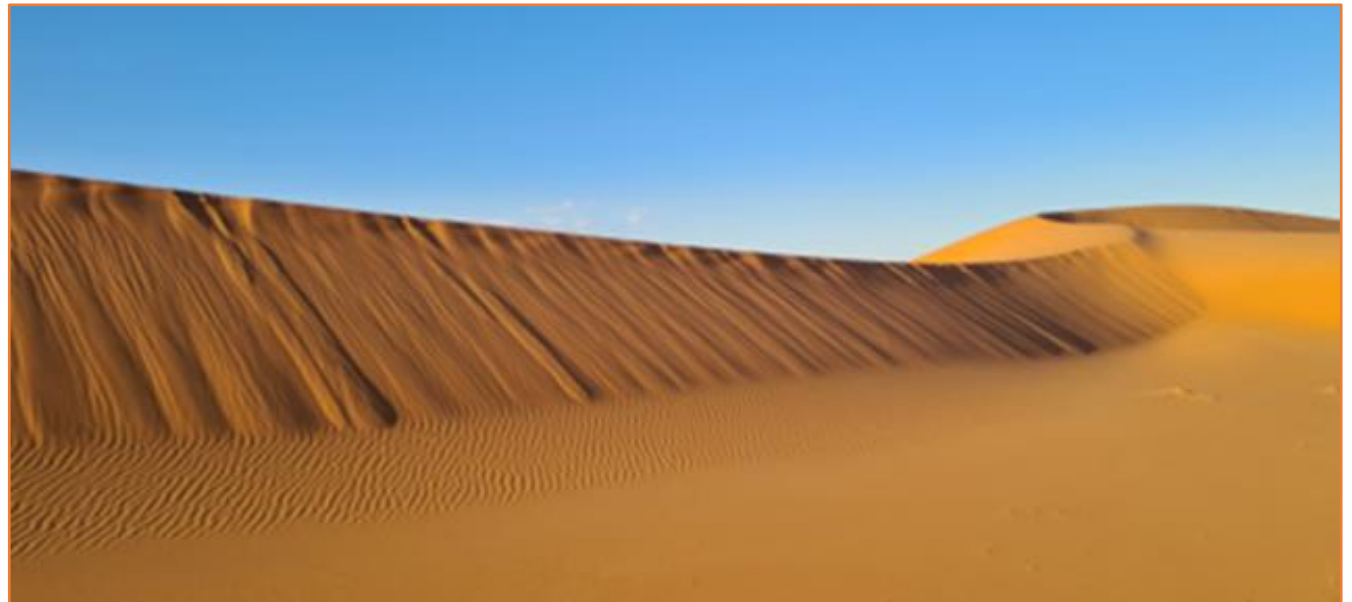
Erg CHEBBI de MERZOUGA