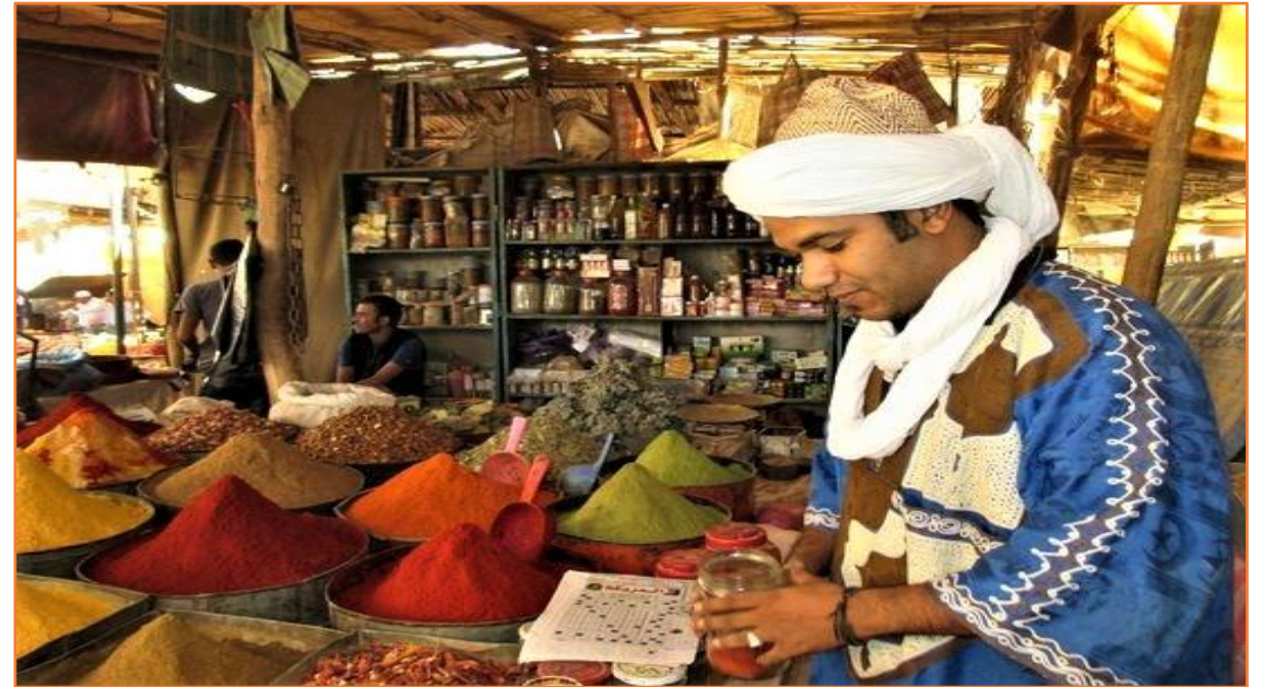
SOUK du Mardi à RISSANI

Au croisement des ruelles couvertes du souk, on trouve la place des dattes, celle des céréales, du bétail, des étalages de denrées alimentaires, le bazar artisanal, les boutiques d'habillement et d'équipements domestiques, ainsi que les ateliers de ferronniers et menuisiers. Le souk comprend aussi un espace de services, où des restaurants proposent une Medfouna (une galette de pain farcie) authentique et