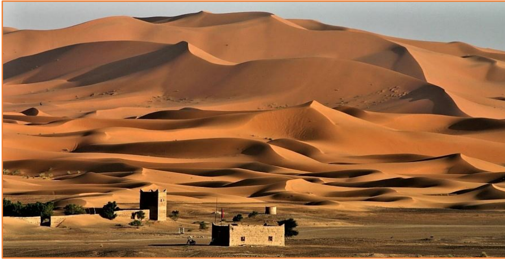
Dunes de YASMINA à MERZOUGA

ait été arrêtée par les exploitants Français, depuis 1965. Dans le Désert de Hamada, à KHAMLIA, où vivent des GNAOUAS, peuple à la peau noire, descendants des premiers esclaves subsahariens libérés, vous écouterez leur musique traditionnelle, en dégustant un thé à la menthe qu'ils ne manquent pas de vous offrir. Après avoir traversé les ergs de ZNAIGUI et de BIGRA, longeant le lit de l'oued ZIZ, vous arrivez à TAOUZ, village où la route goudronnée pénétrant dans le désert se termine et près duquel vous découvrez un site de gravures rupestres. Vous prenez ensuite le repas de midi dans une auberge sympathique du village de JDEÏD. Après le repas, vous découvrez un très intéressant site de gravures rupestres de style libyco-berbère qui se trouve sur les rochers en ligne de crête de la dune du djbel TIJAKHT. Vous empruntez les célèbres pistes du Paris-Dakar pour rejoindre la Kasbah OUZINA ou vous vous apprêtez à passer une nuitée Saharienne.