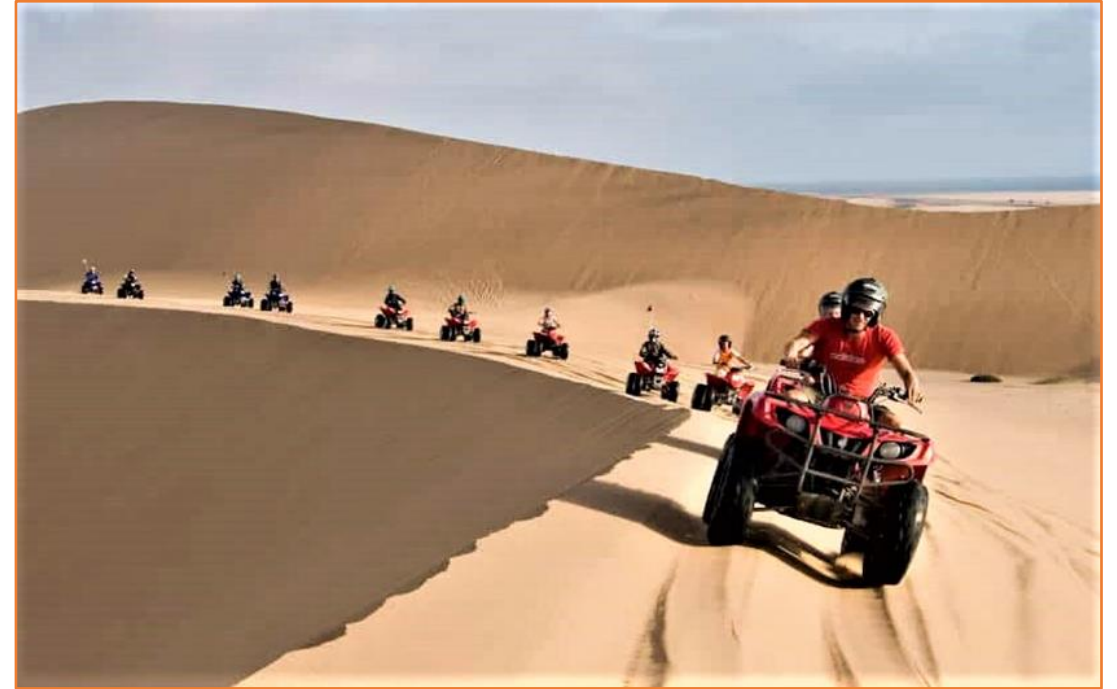
Ascension de l'erg CHEBBI de MERZOUGA

Votre progression vous conduit dans l'intimité de la petite oasis inhabitée de SAFSAF.... Seul le murmure de l'écoulement de la cascade, accompagné du bruissement du vent du désert dans les rames des palmiers, produisent une douce et mélodieuse harmonie.... Après une promenade dans la palmeraie de l'oasis, vous apprécierez un pique nique berbère et il sera l'heure....., il faut bien vous résoudre à quitter cette palmeraie enchantée.... Vous empruntez alors les fameuses pistes traversant des paysages sauvages de regs et d'ergs, tout ce qui, dans un sentiment de liberté, attise votre avidité de découvertes naturelles... ! En milieu sauvage, votre trajet alternera entre le lit d'un oued asséché et les célèbres anciennes pistes qui par le passé, firent la gloire du rallye PARIS – DAKAR.»..... Arrivés à MERZOUGA, vous échangerez vos quads contre des vaisseaux du désert (dromadaires) qui vous mèneront au plus haut des dunes, pour pouvoir contempler, avec la complicité de dame météo, un merveilleux SUNSET (coucher de soleil). A la nuit tombée, les dromadaires vous ramèneront dans un bivouac VIP, où vous prendrez le repas du soir avant de participer à une veillée Berbère animée.