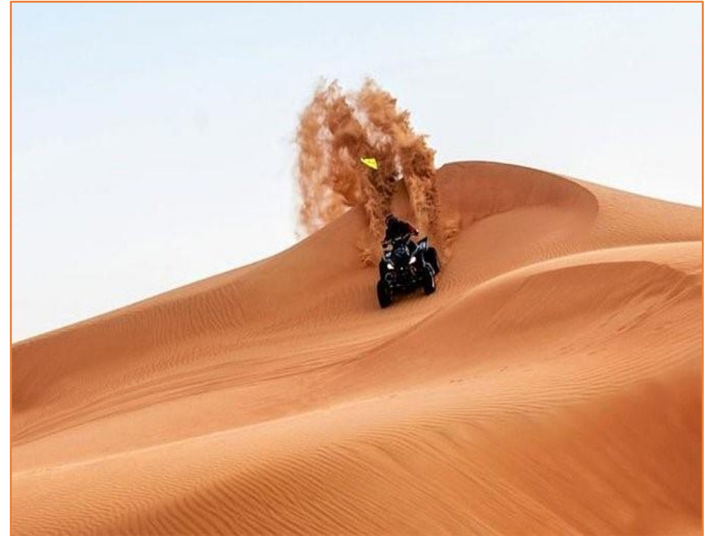
Successions de dunes

Sitôt le petit déjeuner dévoré, l'étape débute à 9 heures, par la traversée des dunes de l'erg CHEBBI, durant laquelle vous découvrez la petite et surprenante oasis d'OUBIRA. Les creux et les bosses des dunes se succèdent dans une sensation d'immensité. Votre Quad puissant et obéissant, escalade et descend, à votre écoute, pour vous procurer toujours plus de sensations..... Au delà de l'erg CHEBBI, dans l'infinité des regs vous ne manquez pas de rencontrer des nomades aux conditions d'existence incroyables, ce qui ne les empêchera toutefois jamais de vous accueillir en vous offrant un verre de thé à la menthe et un morceau de pain chaud. Vous découvrez les anciennes mines de M'FIS, encore aujourd'hui objet d'une exploitation artisanale par des mineurs en quête de quartz et de khôl, bien que l'exploitation officielle de ces mines de barytines