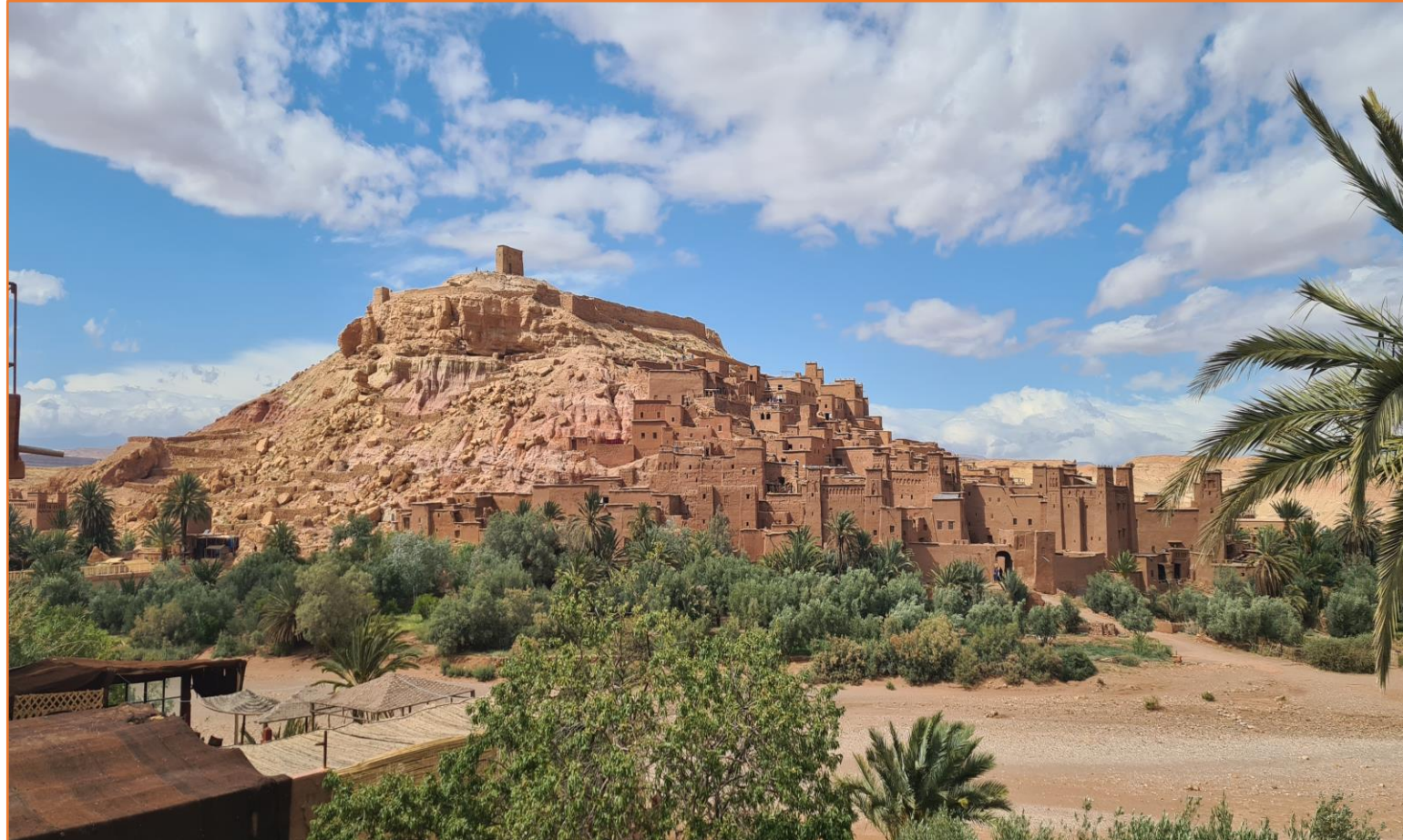
Kasbah d'Aït BEN HADDOU

8h30 - Après le petit déjeuner, le groupe entreprend une visite de l'exceptionnel Ksar d'AÏT BEN HADDOU, situé sur les contreforts des pentes du Haut Atlas, dans la province de Ouarzazate. Le site d'Aït-Ben-Haddou est le plus célèbre des ksour (Ksour = pluriel de Ksar) de la vallée de l'Ounila, il est un exemple frappant de l'architecture sud Marocaine. Le Ksar est un groupement d'habitations essentiellement collectif, à l'intérieur de murailles défensives. C'est un extraordinaire ensemble de bâtiments offrant un panorama complet des techniques de construction en terre présahariennes. Les espaces publics du ksar se composent d'une mosquée, d'une place publique, des aires de battage des céréales à l'extérieur des remparts, d'une fortification, d'un grenier au sommet du village, d'un caravansérail, de deux cimetières (musulman et juif) et du sanctuaire du saint Sidi Ali. 11 h 30 – Prise de repas au Riad MAKTOUB. 13h00 – Départ du Riad d'AÏT BEN HADDOU pour un transfert à l'aéroport de OUARZAZATE, pour se trouver à 13 h 30 à l'enregistrement des bagages de l'aéroport, où se terminent les prestations d'ALSEO.