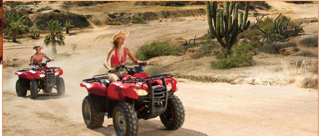
Plaisirs du désert

A 9 heures, après le petit déjeuner matinal, vous enfourchez votre Quad, pour emprunter d'autres anciennes pistes du rallye PARIS – DAKAR, afin de vous rendre aux dunes d'OUZINA, dans un décor de montagnes noires et dunes orangées. Pour votre plus grand plaisir, vous franchissez creux et bosses aux formes douces des ergs d'OUZINA. En longeant l'oued asséché du ZIZ, votre étape vous mène sur le LAC RAMLIA où la planéité surprenante de ce grand espace asséché permet aux amateurs, quelques pointes de vitesse. Vous longez les dunes ZEREG avant de parvenir au lac MAIDER et de vous rendre à TAFRAOUTE SIDI ALI pour y prendre le repas de midi.