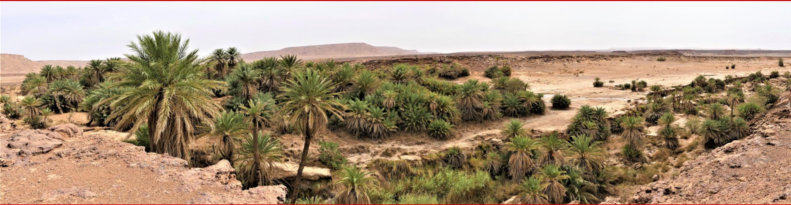
Oasis de SAFSAF