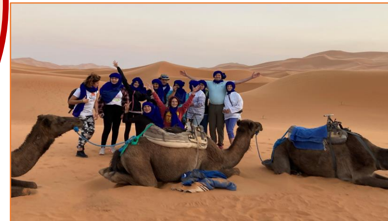
Dans l'attente du coucher du soleil