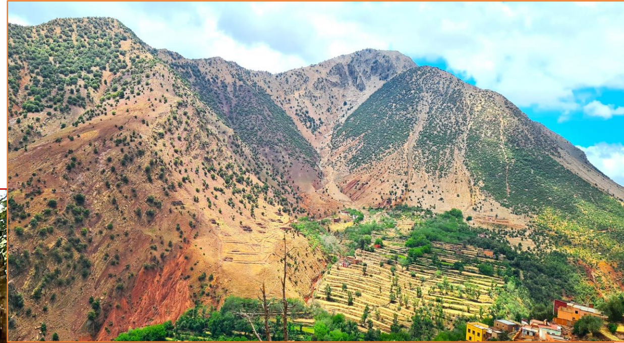
Paysage minéraux du djebel

Ca et là, les nomades faisant paître leurs troupeaux, vous invitent chaleureusement à venir prendre un thé à la menthe sous leurs campements. Aux pieds du djebel SAGHRO, vous parvenez à IKNOUEN, village capitale de la très puissante tribu Marocaine des AÏT ATTA. Vous y prenez votre repas de midi dans une auberge sympathique. Après le repas, vous vous dirigez vers BOUMALNE DE DADES où, un bain dans la piscine de l'hôtel ou vous ferez étape, ne sera certainement pas de refus...! Vous prenez votre repas du soir dans une Kasbah pour une bonne nuit de repos.