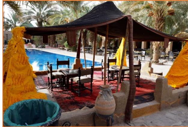
Piscine extérieure de la kasbah XALUCA D'ERFOUD

https://xaluca.com/fr/kasbahhoteltombouctou