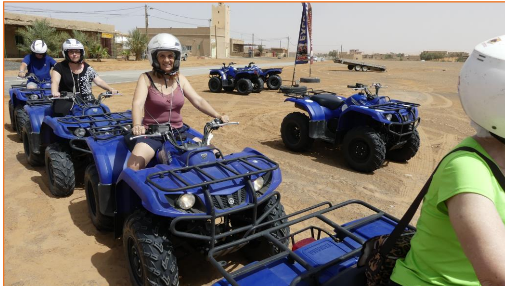
Départ pour la rando