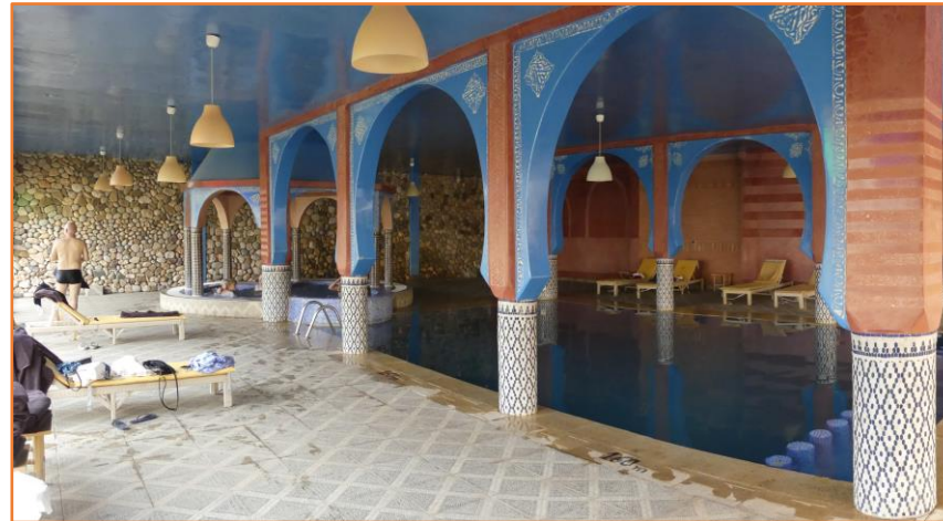
Piscine couverte - chauffée