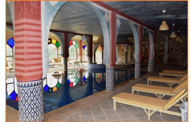
Piscine intérieure chauffée et jacuzzi