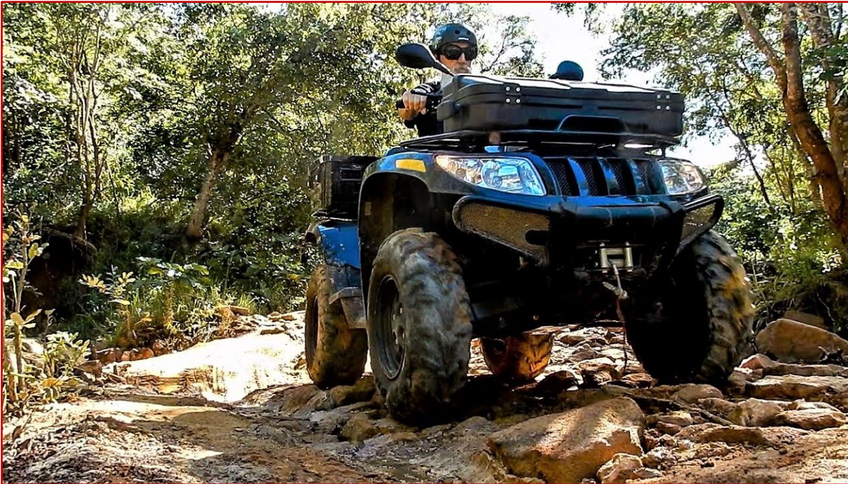
Quad en montagne

A 9 heures, après le petit déjeuner matinal, vous entreprenez l'ascension du versant Sud du djebel SAGHRO (jusqu'à 2712 m d'altitude). Cette ascension se réalise en empruntant 60 Km de piste de montagne « non stop », traversant vallées et petits villages isolés. La descente du djebel par le versant Nord, vous réserve le spectacle de paysages minéraux sauvages et déchiquetés, aux couleurs variant avec la luminosité solaire.