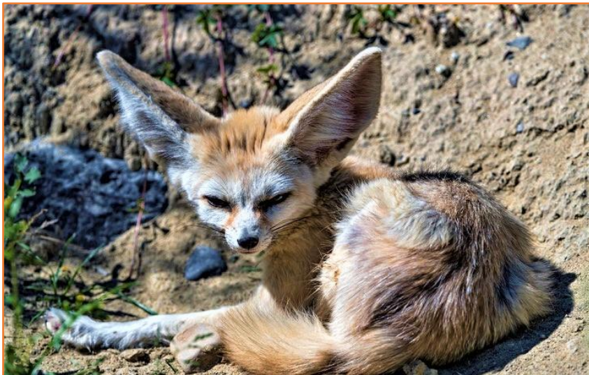
Fennec du désert

L'heure du repas étant proche, vous vous rendez déguster un repas chez l'habitant, à RISSANI où vous découvrirez la spécialité culinaire de la ville : La MEDFOUNA. Vous consacrez le début d'après midi au parcours d'un circuit touristique dans la palmeraie, en minibus autour de la ville de RISSANI, avant de regagner ERFOUD où vous visiterez le célèbre marché aux dattes, dont ERFOUD est la capitale Marocaine. Au terme de quoi vous regagnerez votre Kasbah hotel TIZIMI, où vous passerez la soirée et la nuit.