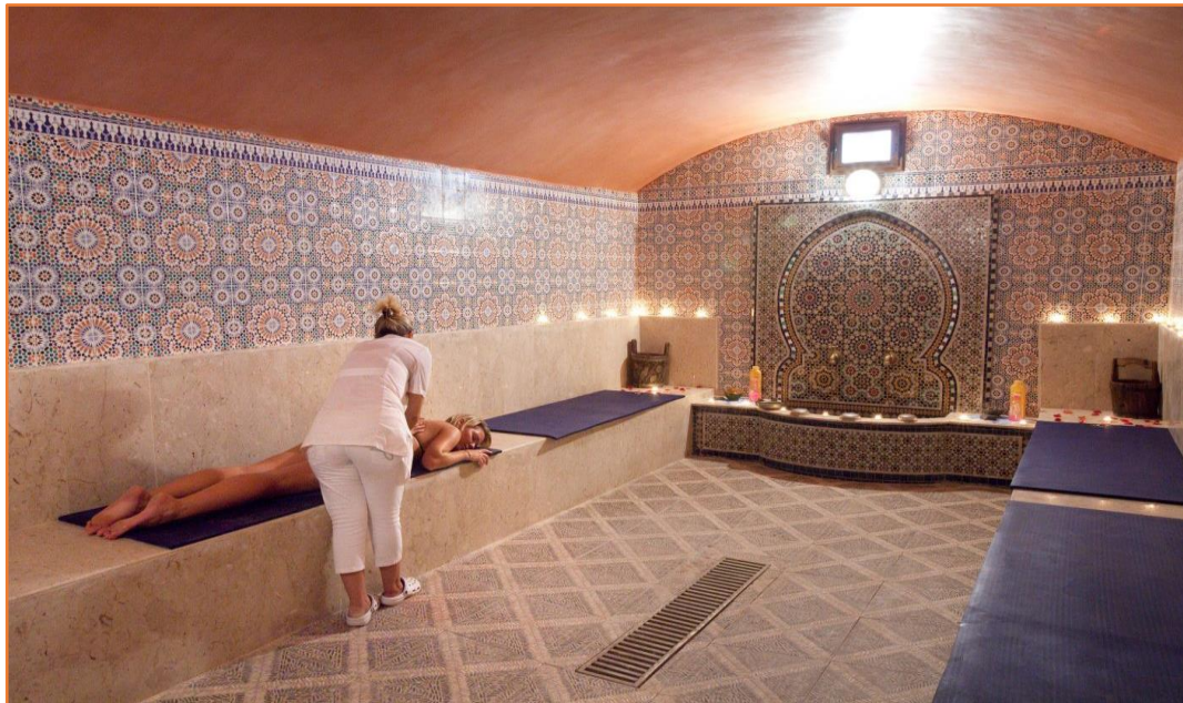
Soins du corps (non compris dans le séjours à ERFOUD)

En début d'après midi, vous prenez le minibus, pour aller découvrir un village caché derrière les dunes de l'erg CHEBBI « KHAMLIA » où vit une communauté de descendants d'anciens esclaves noirs, ils vous livreront un spectacle de présentation musicale GNAWA. Avant de retrouver les quadeurs dans un bivouac VIP, vous vous rendez à l'oasis de MERZOUGA, où vous découvrez les ingénieux système d'irrigations (principe datant des PERSES) appelés KHETTARAS qui