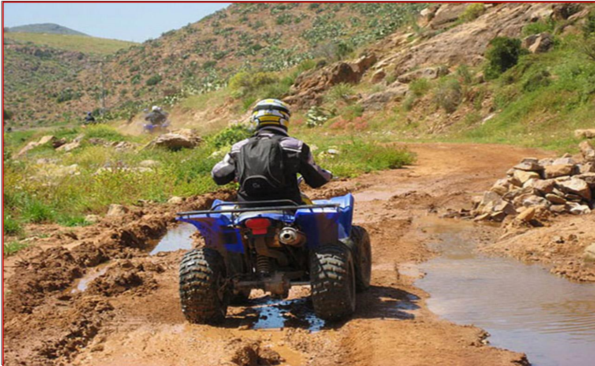
Piste de montagne

A 9 heures, après le petit déjeuner matinal, vous vous engagez dans la vallée du DADES jusqu'au douar d'AÏT YOUL, où vous prenez une piste de flancs de montagnes du haut ATLAS, sur laquelle vous pouvez rencontrer des nomades troglodytes, vivant avec leurs animaux dans des grottes. Passé le village de BOUTAGHAR, vous retrouverez les accompagnants au village de TOURBIST, pour entreprendre avec eux, une randonnée à dos de mulets, dans des espaces sauvages, jusqu'au village de HDIDA.