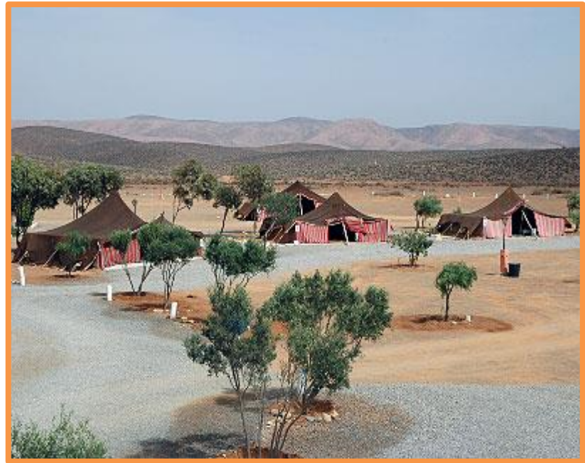
Khaïmas à FORT BOU JERIF

200 légionnaires vivaient là, gardés par deux tours de guets situées sur les sommets des collines à l'ouest et à l'est du fort. Ces bâtiments furent abandonnés par les Français lors du retrait du Protectorat, en 1956 et les Marocains les occupèrent à leur tour, jusqu'en 1969, date à laquelle les Espagnols abandonnèrent l'enclave de Sidi Ifni au nord et le Sahara espagnol au sud, il n'y eut donc plus de frontière à surveiller. Si le cœur vous en dit vous savourerez le plaisir d'une baignade dans la piscine de l'auberge, en plein désert Saharien, avant de prendre le repas du soir.