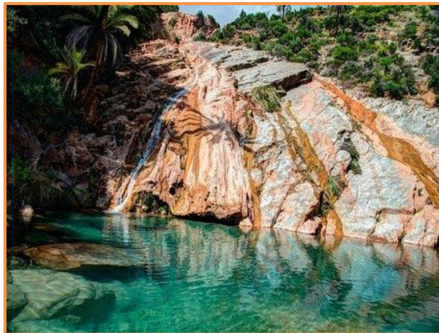
Vallée du Paradis

Ceux des participants acceptant une petite marche d'une demi-heure, se rendront au must de la vallée du Paradis, entre piscines naturelles et Gueltas bordées de canyons impressionnants.