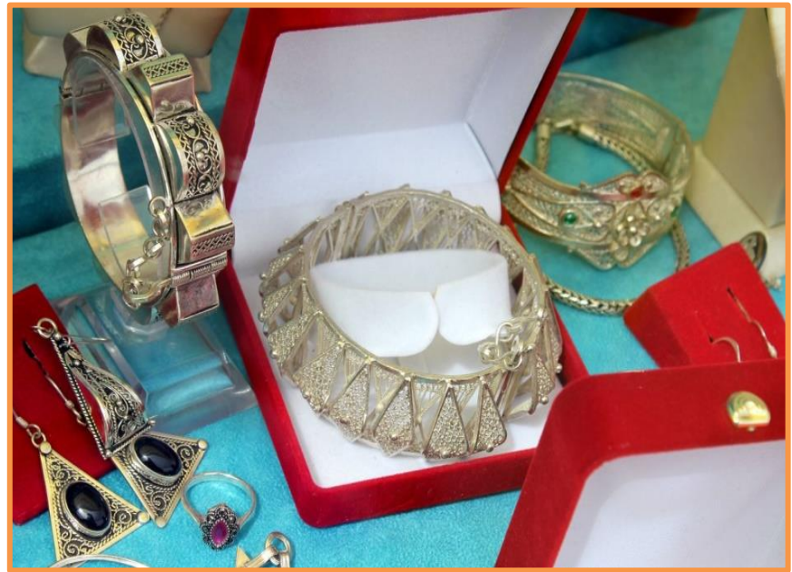
Ville de Tiznit, capitale de l'argenterie et la bijouterie fantaisiste Marocaine

Vous vous rendez ensuite dans un club de quads de montagnes, proche de TIZNIT, à OUIJJANE, où ceux qui le souhaitent enfourcheront des quads passe partout, pour participer à une superbe randonnée montagnarde dans les plissures de l'Anti-Atlas. Autre déjeuner surprise à OUIJJANE, avant de poursuivre votre étape en