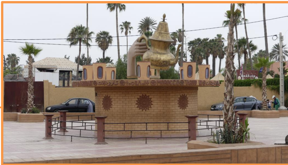
Ville de TAROUDANT

Votre guide, intarissable sur sa ville, ne manque jamais de vous faire une synthèse historique, tout en vous faisant profiter d'une balade en calèche qui vous permet de longer et découvrir les imposants remparts, les tours des fortifications ainsi que les portes TAROUDANNAISES.