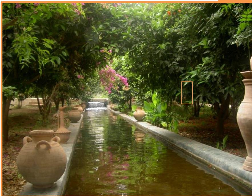
Oasis de TIOUTE