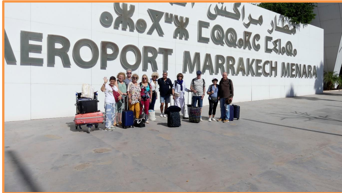
Aéroport de MARRAKECH

*Les conditions aériennes de liaisons avec AGADIR (et le prix aussi), pourraient vous amener à opter plutôt pour une arrivée à Marrakech, ça n'est pas un problème, dans cette hypothèse, nous mettrons à votre disposition une navette qui quittera l'aéroport de MARRAKECH à 13 heures.