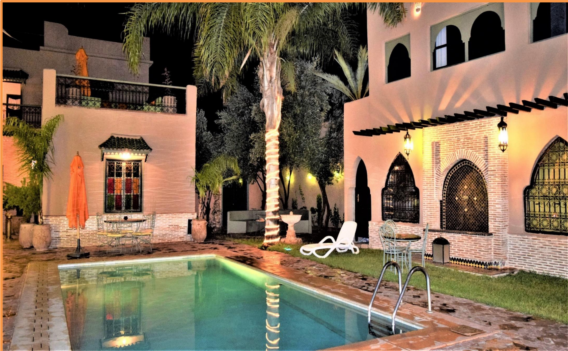
Riad à TAROUDANT

Durant le transfert vous conduisant au Riad NIAMA de TAROUDANT, le guide ALSEO vous transmettra les conseils pratiques ainsi que les consignes de sécurité, afin que la qualité de ce séjour en fasse qu'il reste à jamais gravé dans votre mémoire. Vous parviendrez au Riad pour y prendre votre repas dans une ambiance musicale et passer une nuit de sommeil bien méritée, dans ce havre de paix.