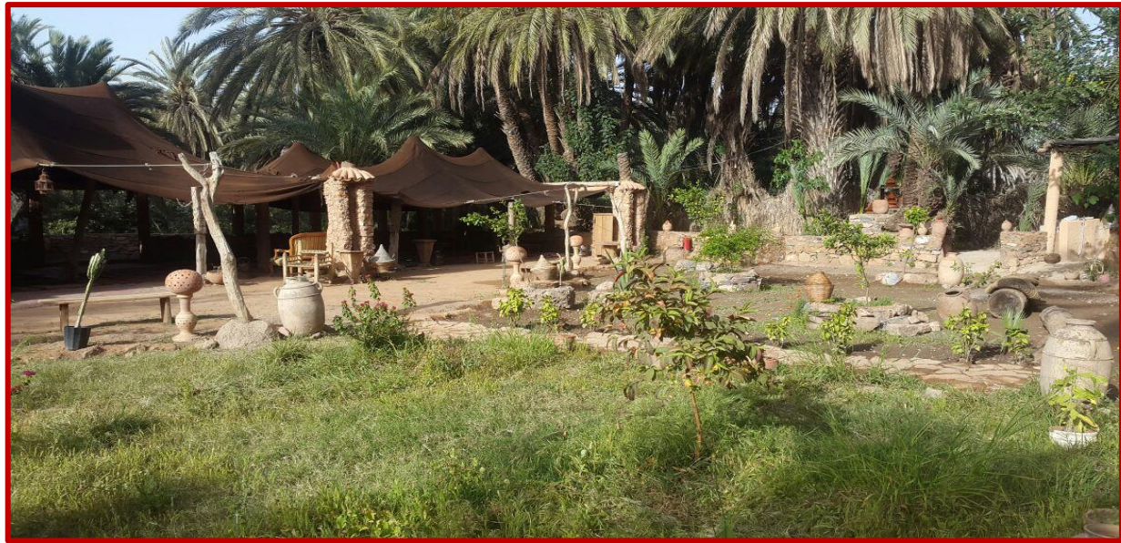
Palmeraie de TIOUTE

Pour ceux qui ne peuvent (ou n'ont pas envie de) participer à cette aventure pédestre, ils pourront rester à bord du bus qui poursuivra sa route, pour aller récupérer les marcheurs, 2 à 3 heures plus loin, dans un micro-village, où l'oued et la route se rencontrent à nouveau. De magnifiques photos en perspective attendent les marcheurs..... La route se poursuit ensuite jusqu'à TAFRAOUT où vous passerez la nuit dans une bien sympathique auberge.