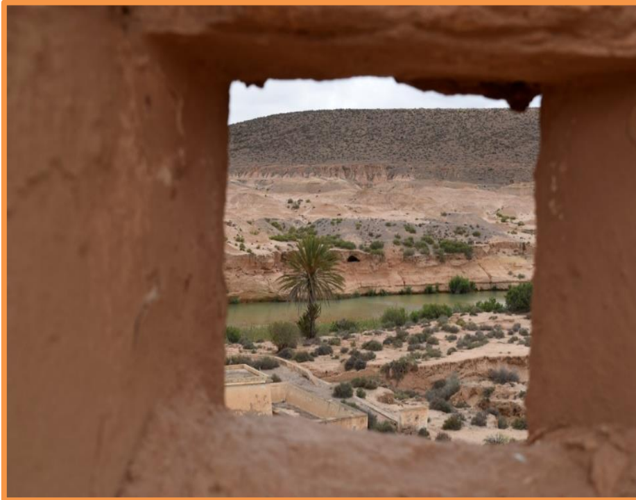
Fortifications du Fort Bou Jerif

Votre étape de la journée se terminera ensuite à FORT BOU JERIF, dans un complexe touristique à proximité des restes de casernements construits par les légionnaires Français en 1935, lors de leur dernière grande campagne de "pacification" du Sud Marocain.