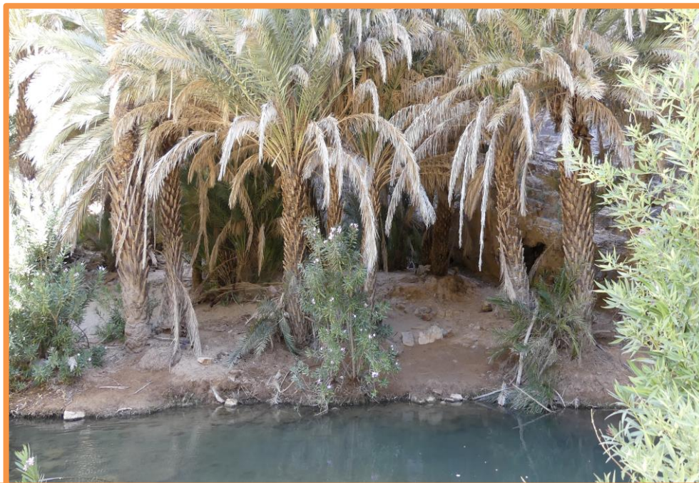
Arrivée dans la vallée d'AÏT MANSOUR

8 h 00 : Après le petit déjeuner, vous quittez TAFRAOUT, capitale Marocaine de la fabrication de babouches, où vous ne manquez pas de découvrir quelques curiosités locales étonnantes de l'environnement de cette ville qui retiendront votre intérêt. Vous prenez ensuite la direction d'une vallée nichée au fond de gorges de granit rose, surplombées d'impressionnants canyons; la route descend en lacets serrés, la végétation d'abord éparse, se concentre ensuite et plus vous approchez des gorges verdoyantes d'AÏT MANSOUR, plus les lauriers roses bien fleuris et les palmiers se multiplient, autour des vasques d'eau de sources et de petites seguias, dominant l'oued qui court en contrebas de tombants montagnards !