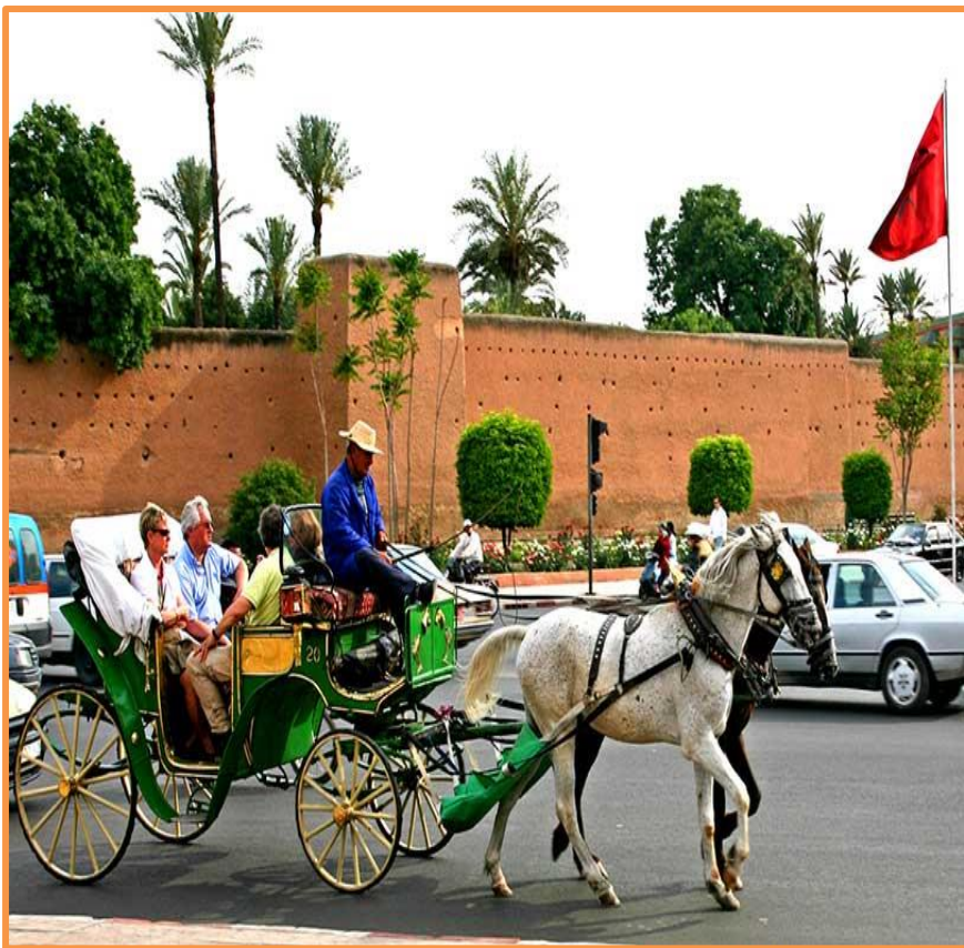
Promenade en calèche à TAROUDANT

8 h 00 : Après le petit déjeuner, l'étape débute par une visite de la « PETITE MARRAKECH »*, puisqu'ainsi a été surnommée TAROUDANT, en raison d'une certaine ressemblance, avec sa grande sœur « MARRAKECH ». Sous la conduite du guide local d'ALSEO, vous participez à une intéressante visite documentée de la « Petite Marrakech ».