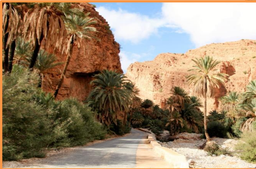
Gorges d'AÏT MANSOUR

. Vous êtes bien dans les gorges de la vallée d'AÏT MANSOUR.