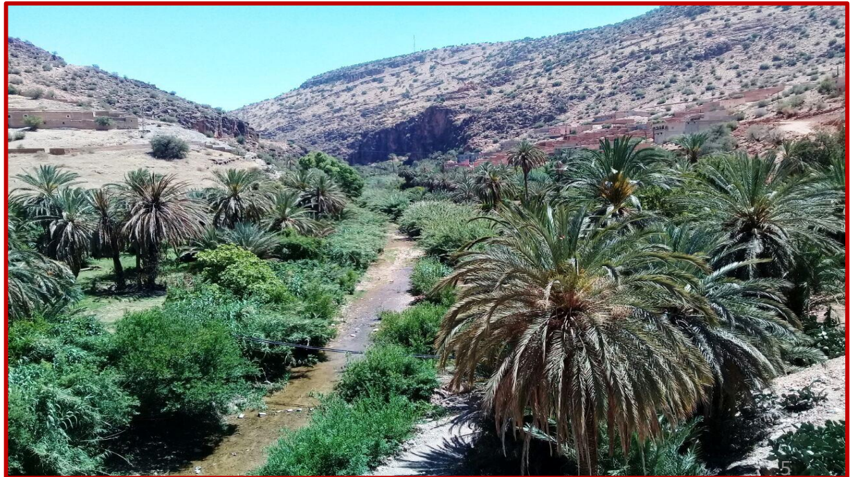
Tronçon du parcours de randonnée pédestre en pénétration des montagnes