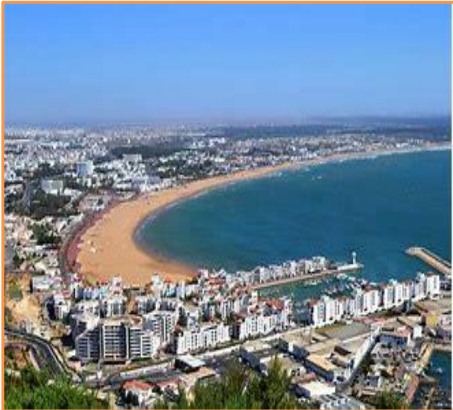
Baie de la ville d'AGADIR

vous rendant dans le surprenant petit désert. Chemin faisant, vous profiterez des superbes couleurs de terres rouges, en harmonie avec le bleu profond du barrage Youssef IBN TACHFINE. La deuxième partie de l'après midi est consacré à la visite de la ville d'AGADIR, sa Kasbah d'altitude, sa Marina et le souk EL KHAD identifié comme le plus grand souk du continent Africain.