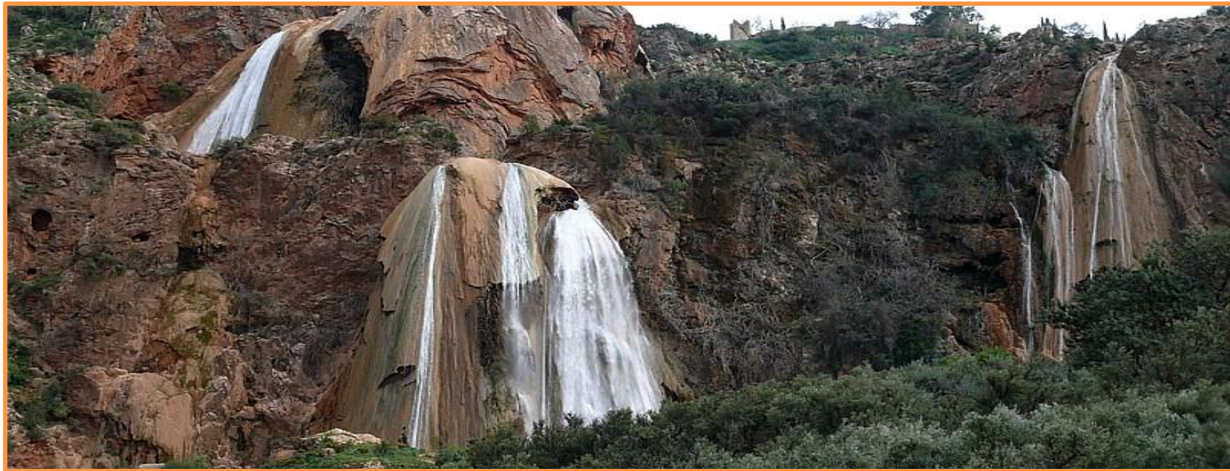
Cascades d'IMOUZZER (Le voile de la mariée)