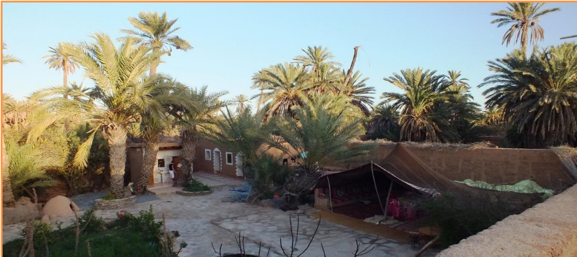
Oasis de TIGHMERT

Comptant parmi les plus anciennes oasis du sud marocain, elle a su, au fil du temps, conserver ses habitants. Autrefois, les hommes bleus étaient des bédouins qui se déplaçaient régulièrement, puis, ils se sont sédentarisés, optant pour l'agriculture. Depuis, ils cultivent des petites parcelles, principalement des cultures vivrières et sont devenus les oasisiens.