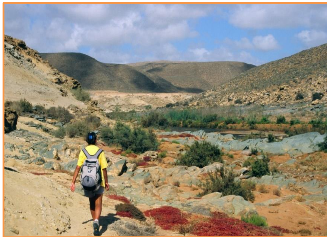
Excursion pédestre de FORT BOU JERIF à FOUM ASSAKA