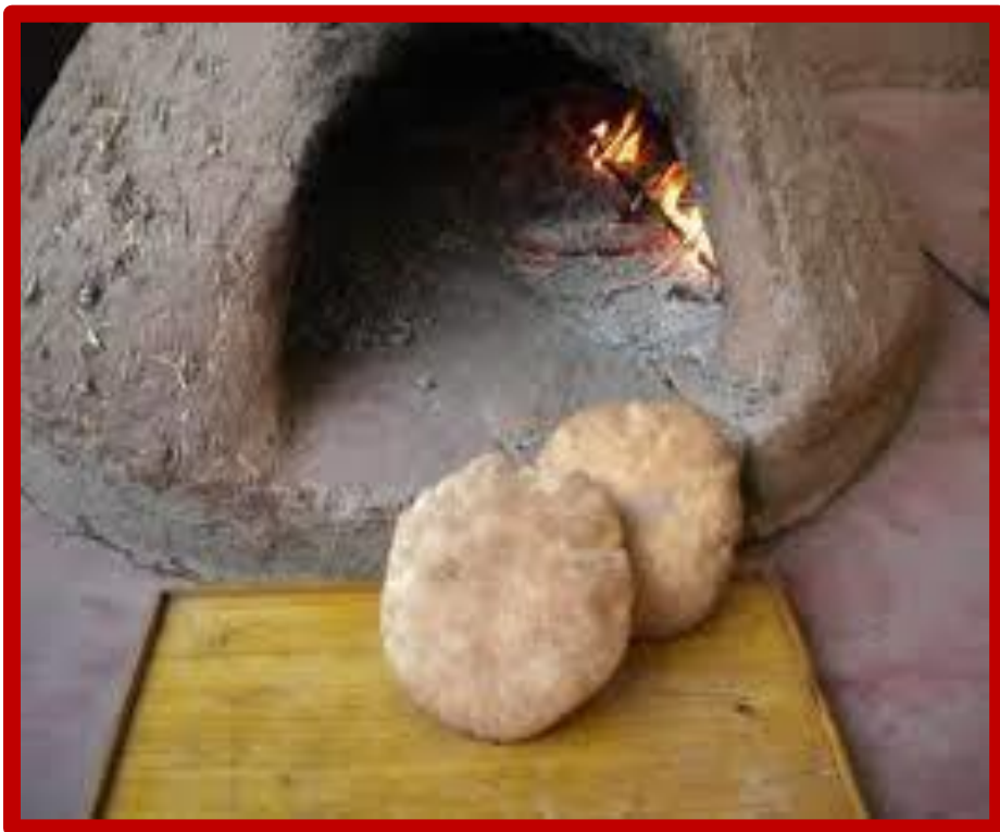
Démonstration de cuissons des 3 pains

Après le petit déjeuner, départ en minibus local pour une super randonnée de 5 heures de marche, avec un dénivelé positif de 300 m, débutant à HDIDA. Vous remontez le cours de l'oued M'GOUN pour parvenir au village juif de TOURBISTE à travers un paysage qui s'apparente à certains massifs du Colorado. Cette étape vous mène aux villages d'AIT SAÏD et TIMISTIGUITE sous la bienveillance du djebel METCHOUG ; elle vous donne l'occasion de parcourir des gorges et de découvrir de magnifiques Kasbah, témoignages d'architecture berbère.