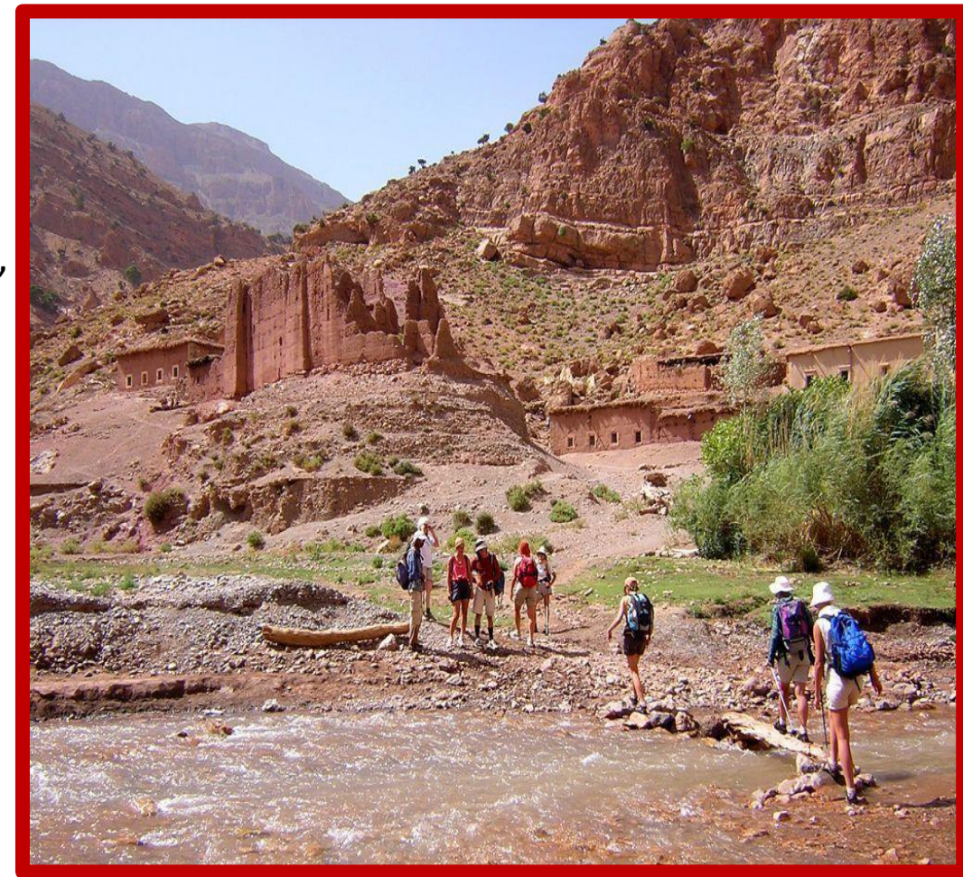
Des randonnées inoubliables !

Vous empruntez ensuite les véhicules de transports qui vous attendent à votre lieu de RV, à HDIDA et vous conduiront à la KASBAH. Vous pourrez y prendre quelques instants de repos ou encore vous familiariser à la préparation de cuisine berbère, avant le repas du soir et disposer du temps d'une veillée d'échanges.