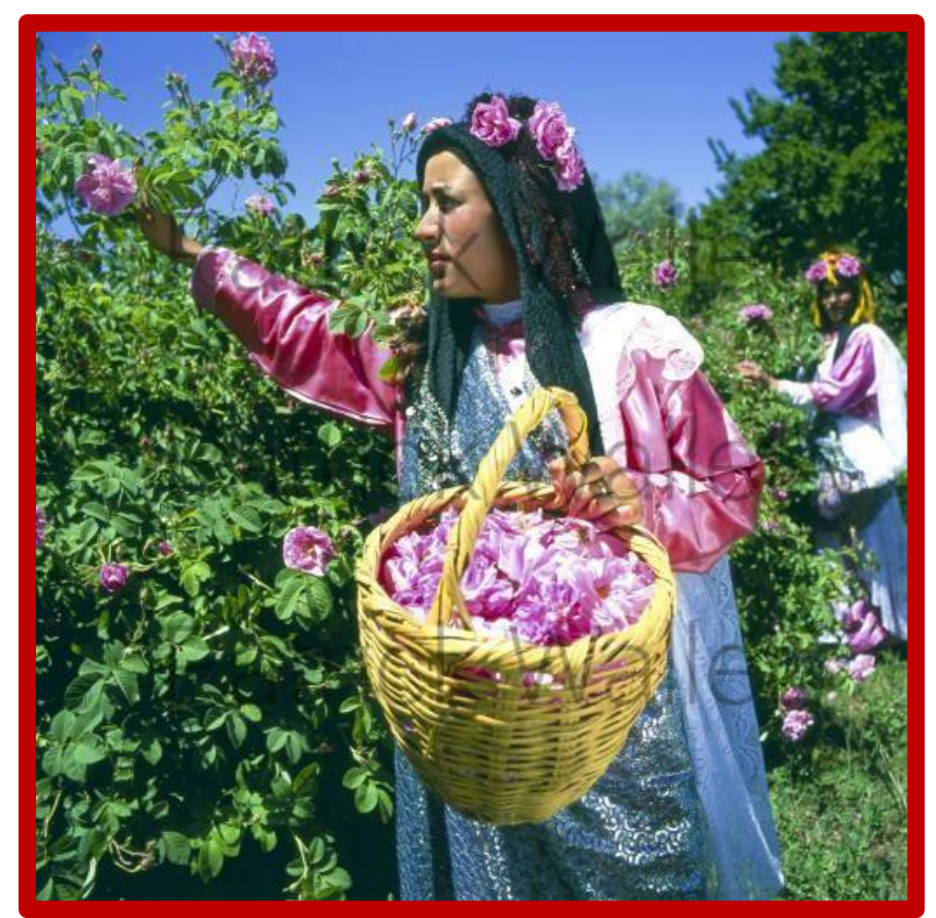
La cueillette des roses Damasquinas

Le séjour que vous propose ALSEO offre un renouvellement quotidien de superbes balades dans des champs de rosiers, de luzerne, de maïs, d'orge, de noyers, de figuiers, de cognassiers, de pommiers, d'amandiers, de vignes, de petits jardins potagers, au gré de magnifiques villages en pisé, implantés de ci de là, revendiquant chacun leurs propres originalités et vous permettant ainsi de découvrir les merveilles du haut et du moyen Atlas. Ces excursions se réalisent chaque jour, sur des parcours de 4 à 5 h