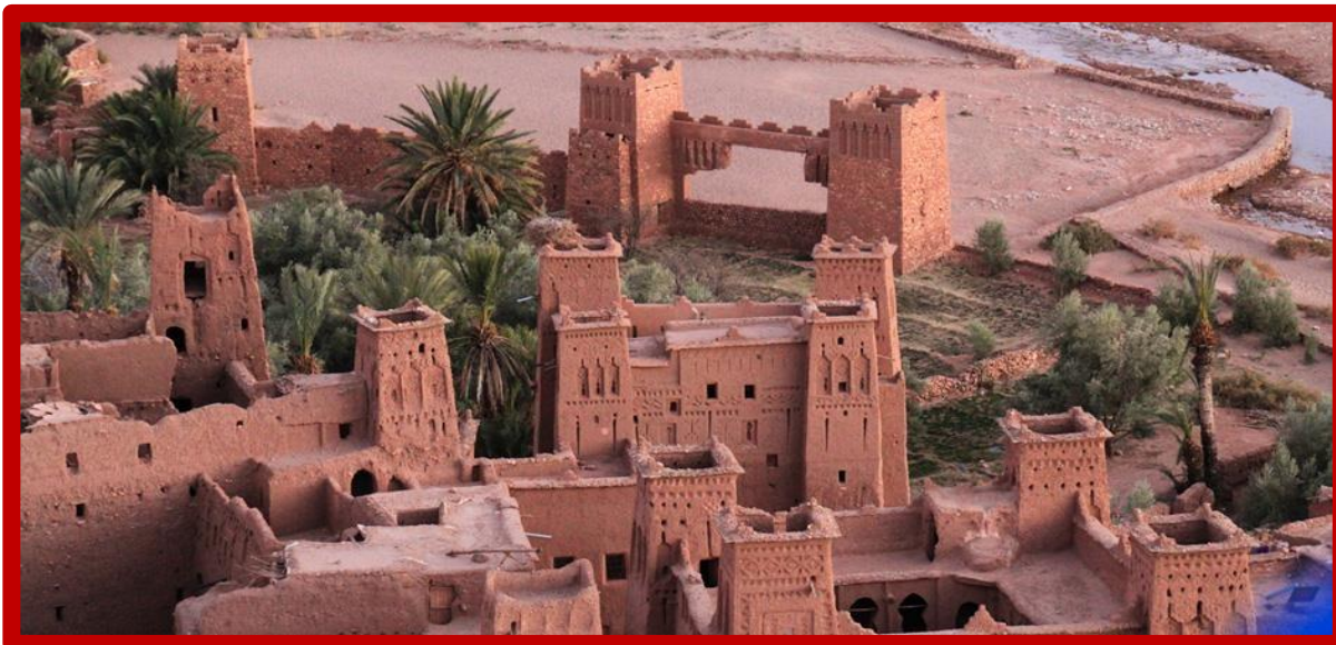
Kasbah d'AIT BEN ADDOU l'unique....