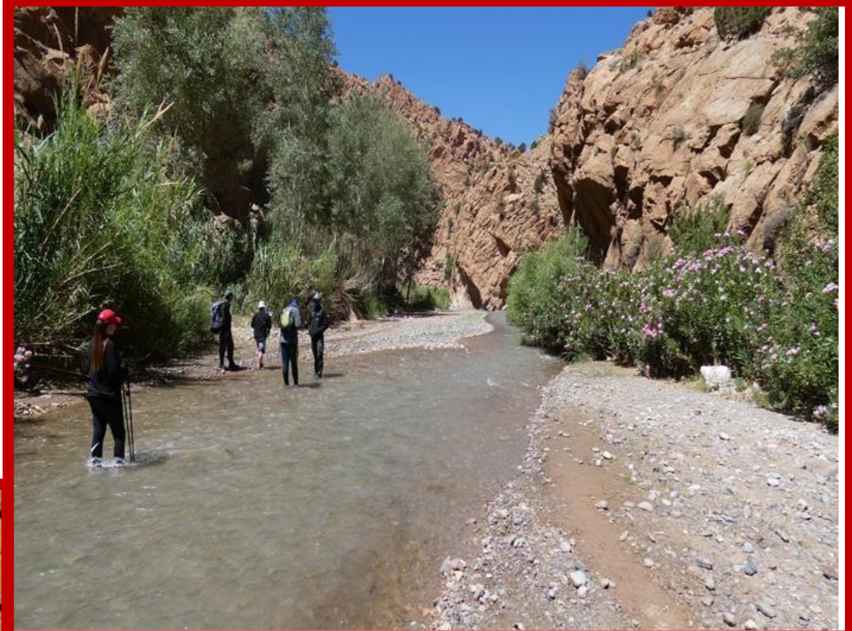
Rando dans les gorges

Au terme de 30 minutes de repos, succédant au repas, vous reprenez la marche jusqu'au village d'AMEJGAL ou le minibus local vous attend pour amener, ceux du groupe qui le souhaitent, visiter une distillerie de pétales de roses et prendre un bain dans le Hammam public d'EL KELAAT M'GOUNA, afin de poursuivre la découverte des traditions Marocaines. Dernière soirée à la KASBAH, derniers échanges du séjour avec votre guide avant le repas du soir et la nuitée.