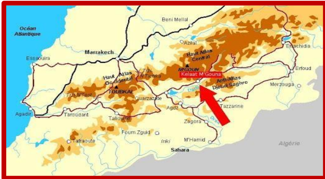
Carte du Sud Est MAROCAIN

Un séjour propice à la découverte des environs de la petite ville d'EL KELÂAT M'GOUNA, point de départ de la vallée des roses, en immersion dans une kasbah familiale tout