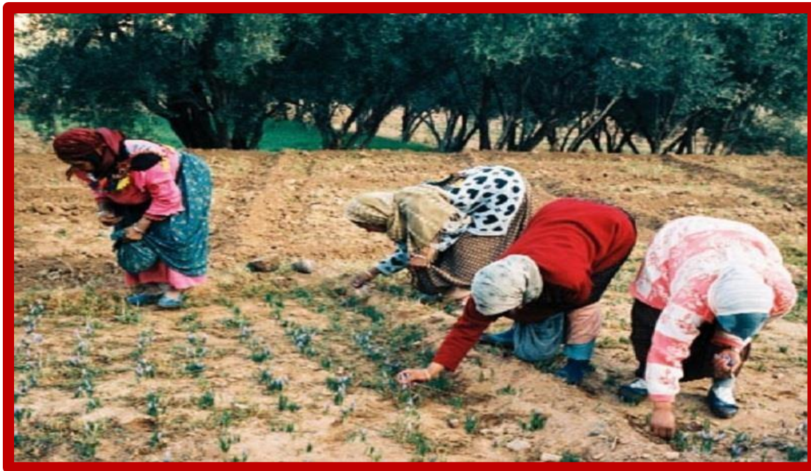
Les femmes berbères très actives dans les travaux des champs.

-Après le petit déjeuner, à travers des jardins en terrasses et de magnifiques Kasbahs qui bordent l'oued M'GOUN, vous débutez votre première randonnée. Vous remontez l'oued M'GOUN et traversant de très jolis paysages et nombreux petits villages, après 3 heures de marche, vous parviendrez à TIGHMATINE, au point de rencontre où vos accompagnants cuisiniers vous auront préparé le repas en plein air, repas constitué de salades – d'un plat chaud cuisiné et d'un dessert, avant l'irremplaçable thé à la menthe. Le repas englouti, après une petite demie heure de repos, vous reprenez une marche de 2 heures en direction de HDIDA.