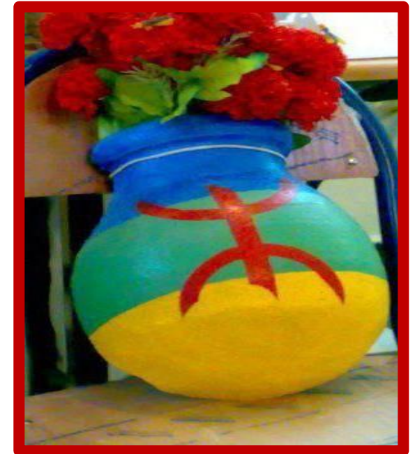
Drapeau culturel et identitaire AMAZIGHE

confort que vous regagnez chaque fin d'après-midi pour y prendre votre repas du soir et y passer la nuit. Vous participez aux découvertes d'activités Agricoles, liées aux cultures et récoltes, suivant la saison (notamment celles des roses DAMASQUINAS, d'avril à fin Mai). Rentré à la Kasbah le soir, si le cœur vous en dit, vous contribuez à la préparation et la cuisson du pain ou du repas, selon les traditions berbères. Si vous le souhaitez, avec votre groupe, vous découvrirez également les pratiques ancestrales du HAMMAM public.