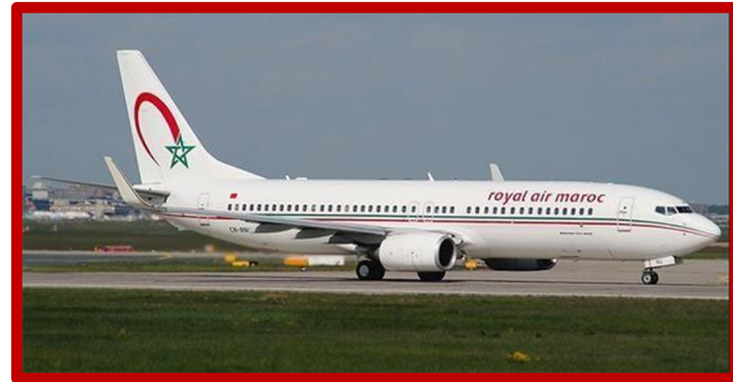
Arrivée à MARRAKECH