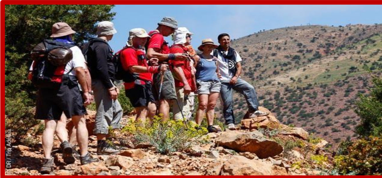
Dépaysement assuré lors des rando en pays Berbère

de marche, à travers de très jolis paysages de la vallée des roses – la vallée d'Aït Ahmed – la vallée du M'goun – la vallée de Toumart, où vous découvrez les activités paysannes de culture et d'élevage et notamment celles des femmes de diverses associations. Les repas de midi cuisinés, sont servis aux participants, chaque jour à mi-étape, par l'équipe de cuisiniers accompagnants le groupe.