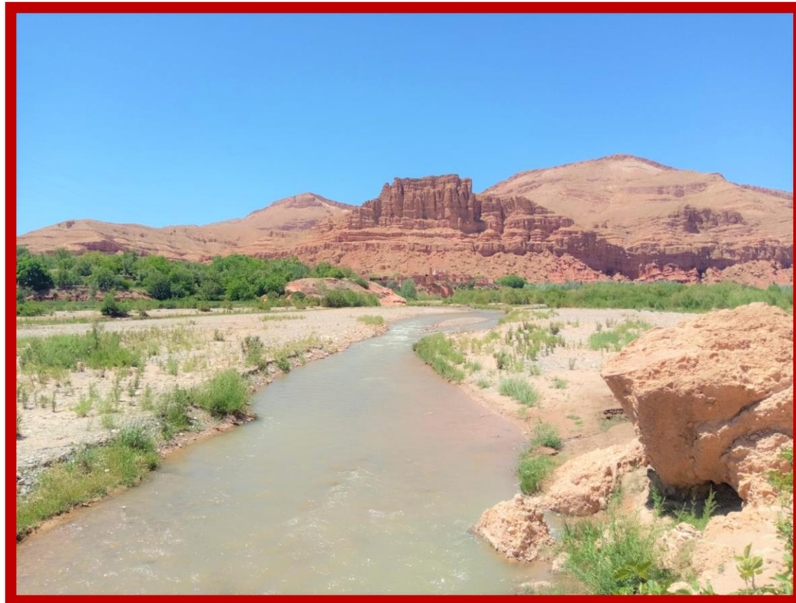
Et toujours la proximité de l'oued M'GOUN

A midi, comme durant toute les excursions du séjour, vos accompagnants vous ont préparé un repas de plein air qui vous attend. Une petite demie heure de repos et les découvertes reprennent, de BOU THARAR à TAMGALLOUNA. En fin d'après-midi, retour à la KASBAH d'EL KELÂAT M'GOUNA en bus local, pour assister à une démonstration de cuissons des 3 pains, selon les us de la région, avant le repas et la nuitée.