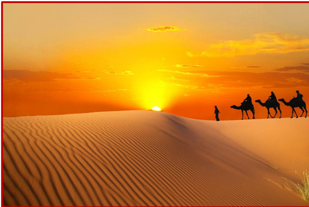
Coucher de soleil entre les dunes

Bienvenue au bivouac..., après une douche, vous avez tout loisir de profiter du plaisir d'une promenade dans les ergs jusqu'à l'heure du repas berbère dégusté avec du pain chaud, cuit dans le sable, suivi d'une veillée musicale Sahraoui agrémentée de chants traditionnels accompagnés de tantam et de gnaouas. Regroupés autour d'un feu de camp, vous prendrez alors la véritable mesure de ce que sont les veillées sahariennes.