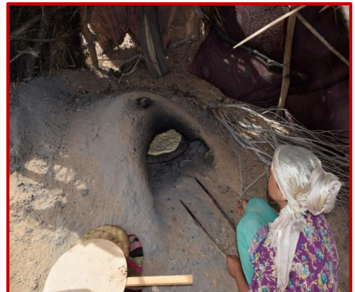
Four à pain