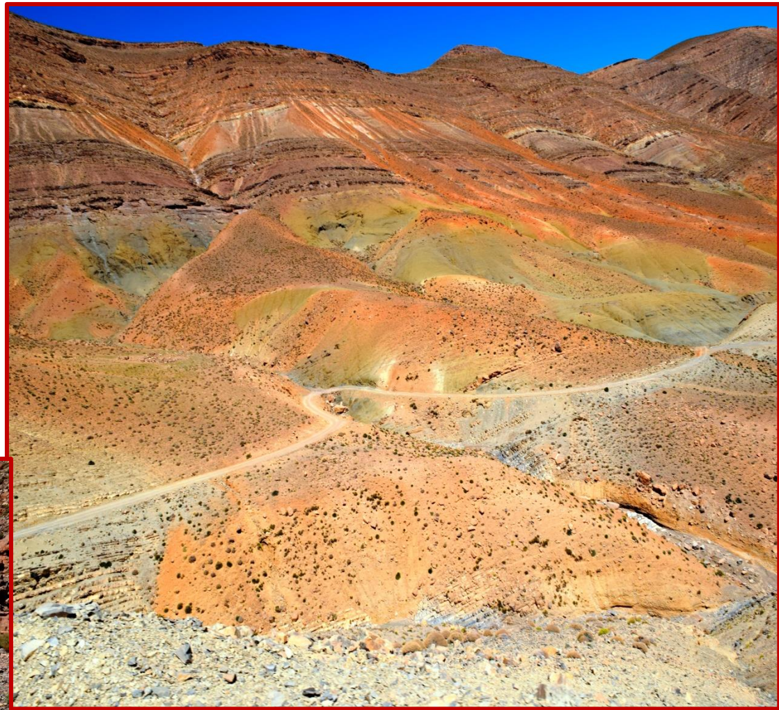
Couleurs des paysages sur la piste reliant les gorges du TODGHA de celles du DADES

Cette piste traverse des paysages de montagnes à couper le souffle, elle emprunte les lits des oueds, elle franchit des cols jusqu'à 2700 m, très peu de gens peuvent y passer et l'espace est vierge, laissant découvrir une palette de couleurs magnifiques dans une luminosité d'exception, pour relier les gorges du TODGHA à celle du DADES. Les seules rencontres se font avec des nomades qui pratiquent la transhumance en ces lieux désertiques.