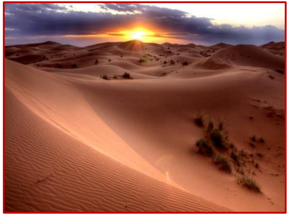
Lever de soleil dans les dunes

Puis c'est le départ en 4x4, à travers les dunes, pour découvrir l'ancien village de MFIS, maintenant abandonné en raison, entre autres, de la progression de la désertification.