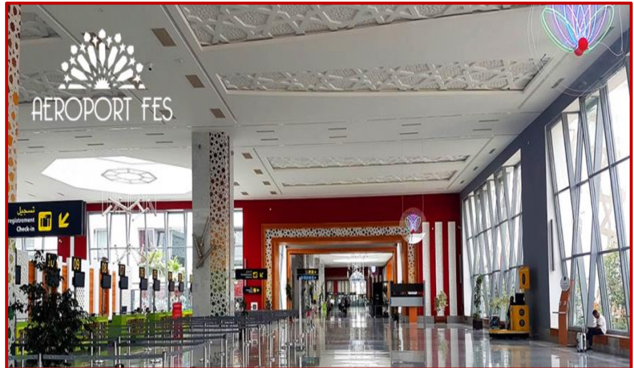
Aéroport de FES

Vous arrivez à l'aéroport de FEZ au Maroc, ville impériale et capitale spirituelle du pays, en fin de matinée. A votre heure de convocation, l'équipe d'ALSEO vous attend. Vous trouvez auprès de vos accompagnants l'aide nécessaire pour rejoindre le bus qui assurera votre transfert vers l'hotel des Météorites de BOULAAJOUL. Ce bus vous suivra tout au long de votre séjour, jusqu'à son terme, à l'aéroport de MARRAKECH.