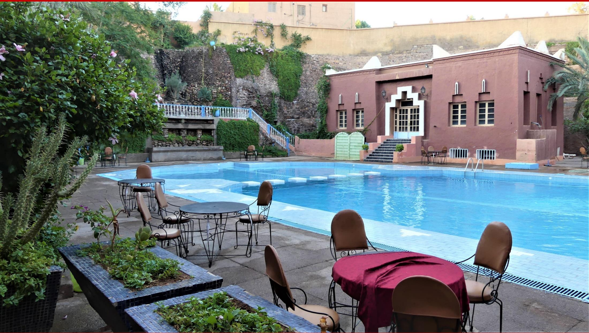
Hôtel FARAH AL JANOUB à OUARZAZATE

Vous continuez votre étape jusqu'à OUARZAZATE où vous visitez une grande et magnifique Kasbah récemment restaurée « La KASBAH DE TAOURIRT ». Vous vous rendez aux plus grands studios cinématographiques du monde, « ATLAS STUDIO d'OUARZAZATE ». Vous y ferez une halte pour visiter le musée où vous découvrez, entre autres, les conservations et l'exposition de très nombreux décors concernant les films Français parmi les plus célèbres. Votre étape se termine dans un hotel 4 étoiles de la ville d'OUARZAZATE où vous prenez le repas du soir et passerez la nuit.