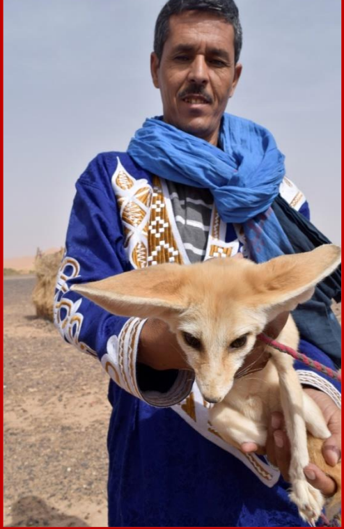
Fennec, le renard du désert

La matinée dans le désert permet également de se rendre à KHAMILIA, dernier village Marocain, à quelques Km du SAHARA Algérien.