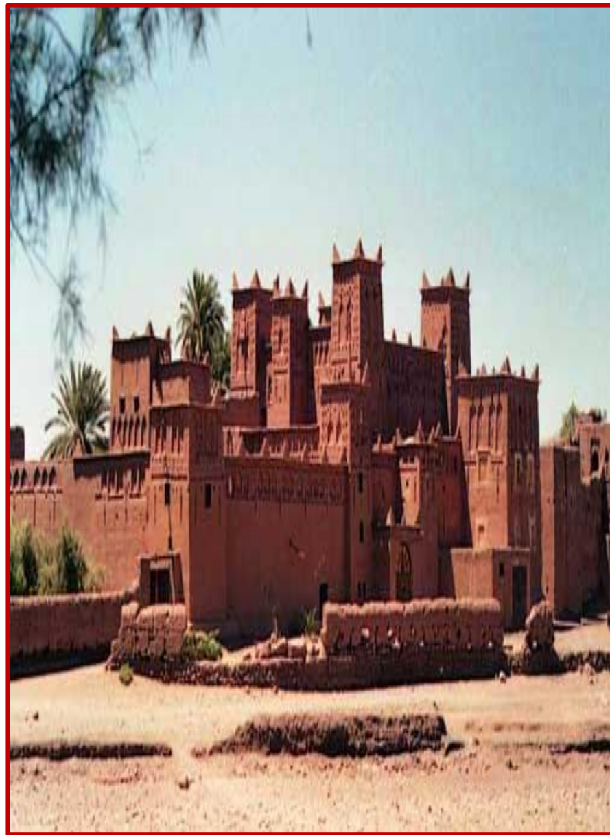
Route des 1000 Kasbahs

Vous êtes éblouis par l'architecture grandiose de cette magnifique Kasbah, vous reprenez alors la direction d'OUARZAZATE, le long de l'oued DADES ; vous baignez dans toute l'authenticité et l'originalité que votre imaginaire n'aurait jamais osé concevoir. Des paysages inhabituels ! Jardins - figuiers - oliviers et amandiers se succèdent, formant aux bords de l'oued, un fond verdoyant, véritable havre de fraîcheur et source de vie pour les autochtones, leurs cultures et leurs petits élevages.