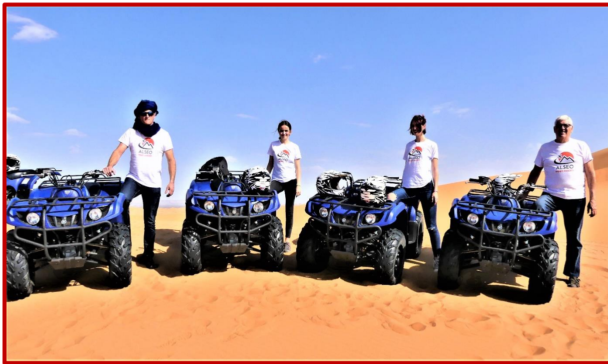
Dunes de MERZOUGA

Après le repas vous enfourchez des Quads YAMAHA de 350 cc pour entreprendre l'ascension du sommet de l'erg CHEBBI (point culminant des dunes sahariennes Marocaines). Il sera ensuite temps de réintégrer le bus pour vous rendre à ERFOUD en milieu d'après midi, afin de profiter des nombreuses infrastructures du magnifique HOTEL KASBAH D'ERFOUD (Hôtel 5 étoiles).