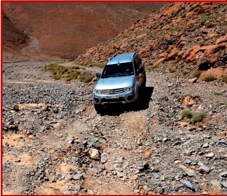
Piste reliant les gorges du TODGHA de celles du DADES

En fin de d'après midi, de pistes magiques en paysages sublimes et sauvages, après avoir parcouru les gorges de l'oued DADES, vous parvenez à BOUMALNE DE DADES pour passer la nuit dans un hotel 5 étoiles où vous profitez des différentes infrastructures de ce magnifique hotel.