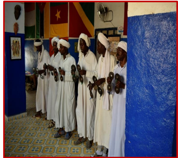
Chants et musiques GNAOUAS

Sur le chemin du retour, vous vous rendez chez les nomades du désert, vous découvrez la difficulté de leurs existences et leur mode de vie de subsistance. L'excursion matinale dans le désert se termine par une visite du lac de MERZOUGA