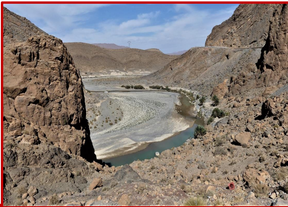
Gorges du ZIZ

Après le petit déjeuner, départ de BOULAJOUL. Sortant du moyen Atlas, vous vous apprêtez à franchir le Haut Atlas, pour achever l'étape de transition qui vous mènera dans le Sud Est Saharien ; vous empruntez la célèbre vallée du ZIZ, surplombant la faille que l'oued a creusé dans un plateau calcaire, offrant ainsi de superbes panoramas sur la route qui vous conduit vers l'interminable palmeraie du ZIZ, de 140 Km de longueur. Le repas de midi sera apprécié autour de la piscine d'une petite auberge « LA MAISON DU ZIZ » où vous jouissez d'une superbe vue sur la palmeraie du ZIZ, dans le village d'AÏT CHAIKER.