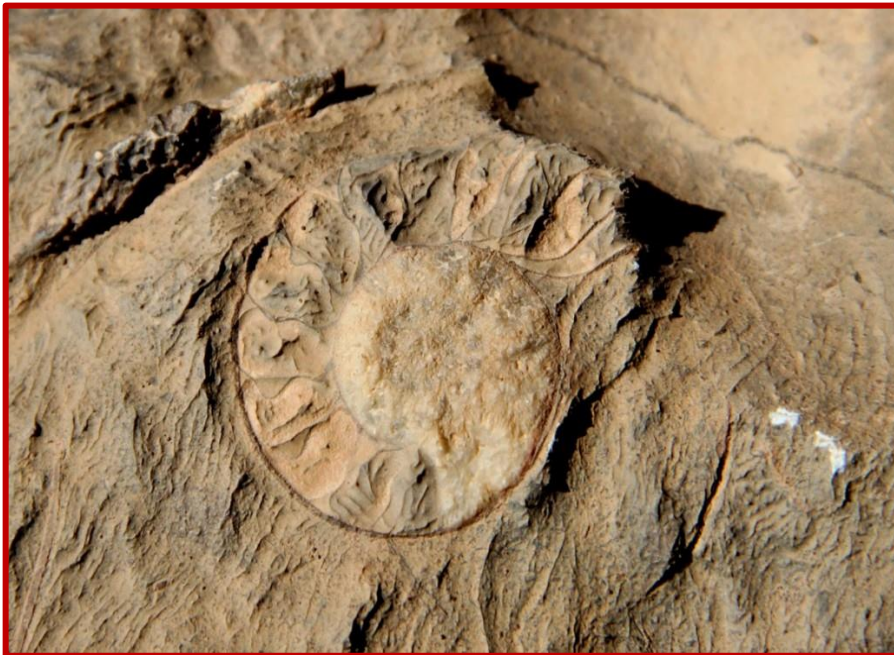
Fossiles dans la Hamada

Dans la HAMADA, vous découvrez des mines qui furent exploitées intensivement par les Français jusqu'en 1965, celles-ci sont quasi abandonnées à ce jour, seuls quelques mineurs Marocains y travaillent à extraire du quartz, du khôl du plomb mais principalement de la Barytine... Plus loin, sur les hauts de la HAMADA, vous trouverez de nombreux fossiles témoignant de la présence des océans à la place du SAHARA, des millénaires plus avant.