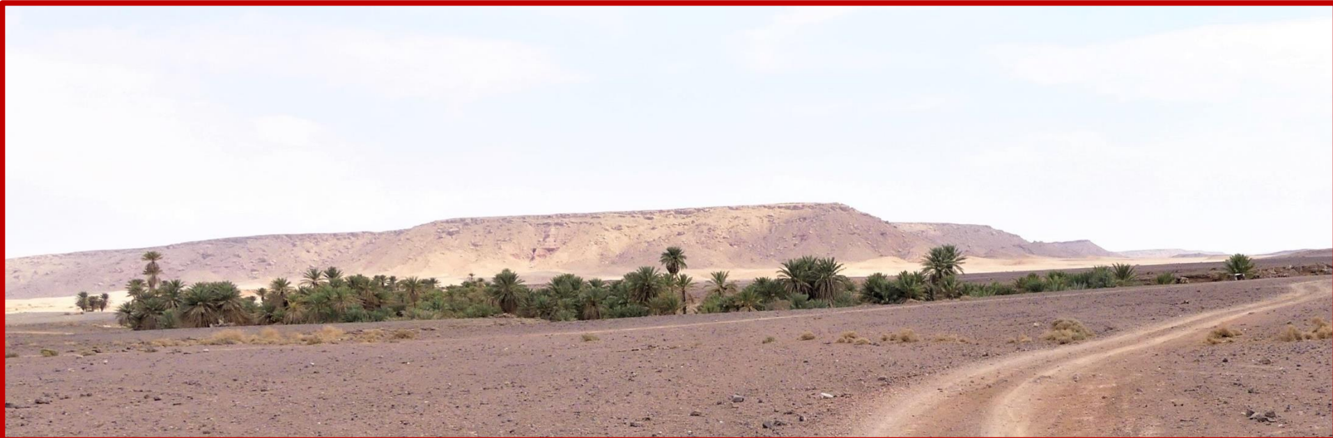
Oasis de SAFSAF

Abandonnant votre minibus pour la journée, vous quittez l'hôtel à bord de 4x4, pour emprunter les ergs et les regs sahariens. Auparavant, ceux des participants désireux de remettre quelques « affaires » scolaires à des enfants nécessiteux, se rendent dans une « petite école du bled », pour offrir leurs présents. « Ensuite » vous pénétrez dans le désert Saharien.... Vous visitez les carrières d'où sont extrait les fossiles d'ERFOUD, et vous vous apprêtez à découvrir une véritable Oasis inhabitée, un lieu de silence et de méditation parmi l'immensité Saharienne, oasis dans laquelle vous déambulez , longeant l'oued qui s'écoule et dont, seul le bruissement de la petite cascade s'emploie à troubler le silence de ce havre de paix.