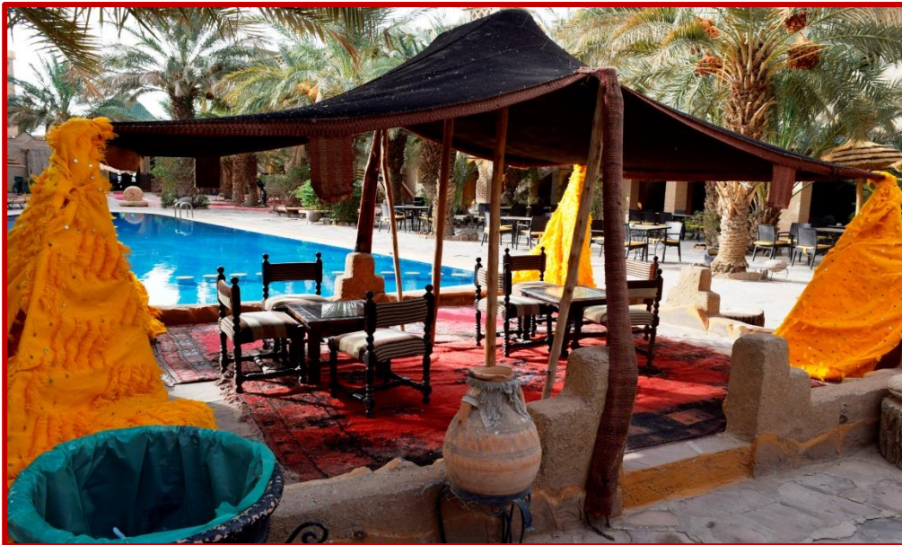
KASBAH HOTEL D'Erfoud