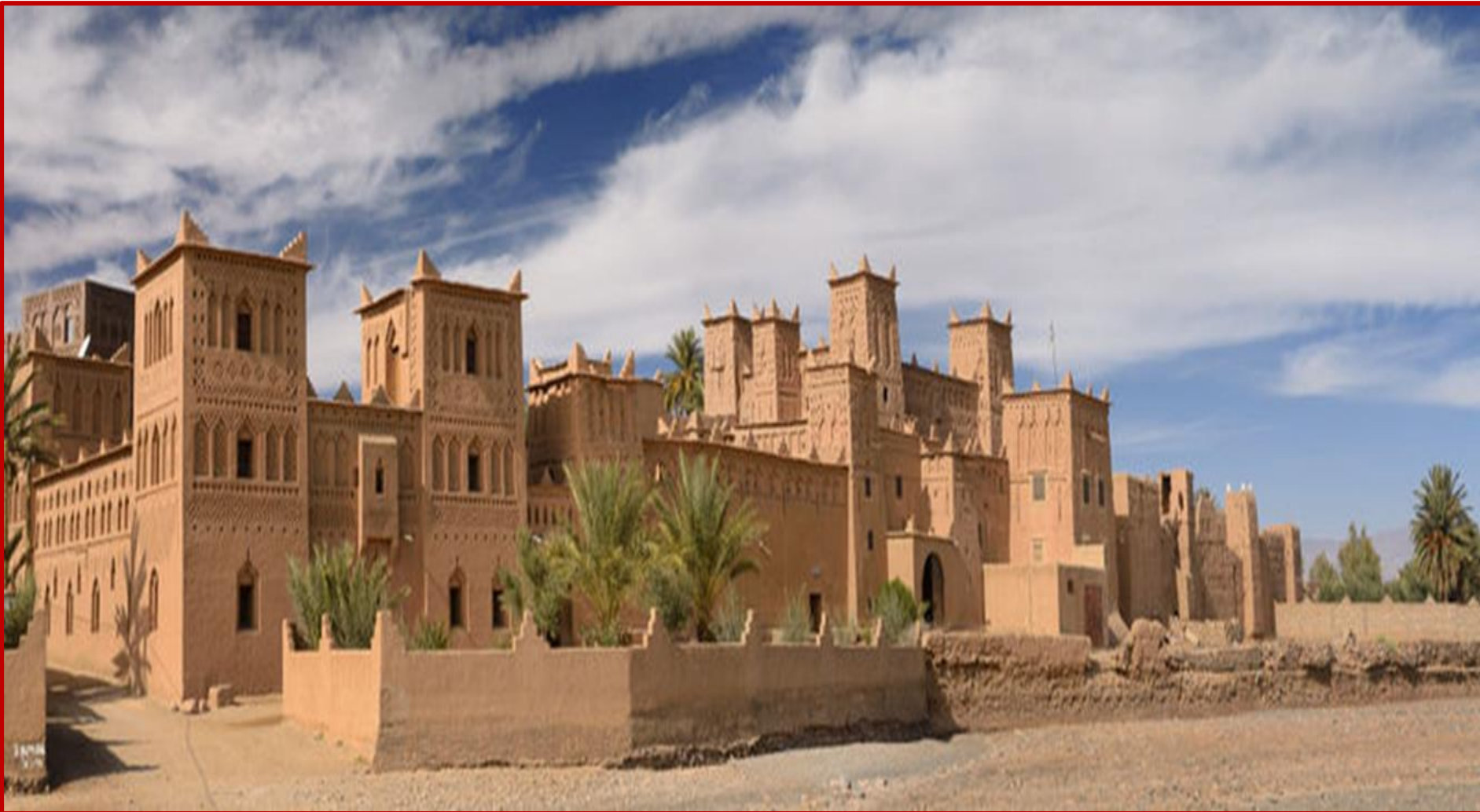
Kasbah d'AMRIDIL à SKOURA

Il ne suffit pourtant pas d'emprunter la « ROUTE DES 1000 KASBAHS » pour voir ces constructions en terre pisé, car celles-ci sont très souvent invisibles de la route, parfois en ruines, parfois disséminées de part et d'autres dans des oasis, au milieu de palmeraies ou dans de nombreux petits douars et villages qui revendiquent chacun leurs spécificités et leurs originalités et ce, tout le long de l'oued DADES que vous continuez d'accompagner, en direction d'OUARZAZATE. A midi vous savourerez le repas dans une véritable Kasbah familiale sise dans la palmeraie de SKOURA.