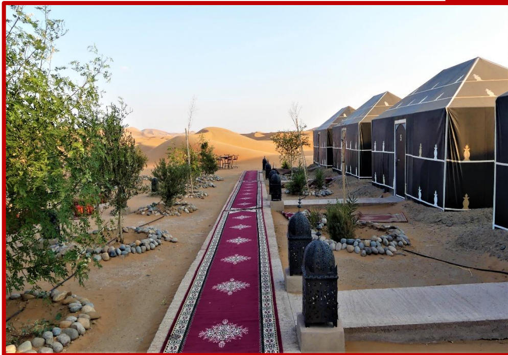
Bivouac à MERZOUGA

La veillée terminée, avant de regagner le confort de votre tente, vous vous allongez dans les dunes pour vous laisser aller à contempler une voûte céleste exceptionnellement étoilée, où, avec avidité, vous prendrez plaisir à « écouter » le silence, comme il est si rare de pouvoir en profiter !