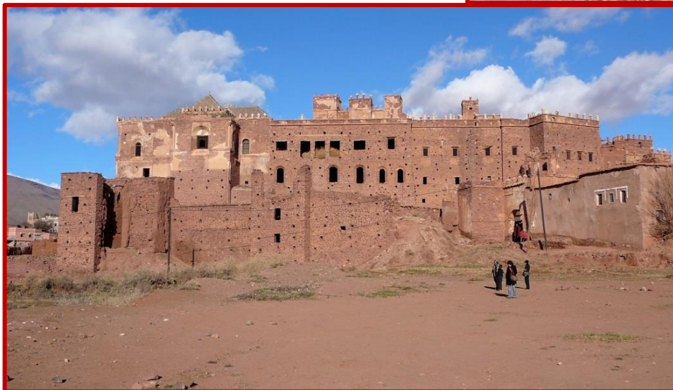
La kasbah du Glaoui

Après TELOUET, votre trajet vers Marrakech nécessite le franchissement du col TIZI N'TICHKA à 2 260 m. Ce col sépare les régions fertiles influencées par l'océan Atlantique, des régions Sahariennes plutôt asservies aux climats secs du Sahara, ce qui ne manque pas de transparaître sur les paysages que vous traversez. Vous prenez votre repas de midi dans un restaurant de montagne, avant de poursuivre la descente du haut Atlas, vers MARRAKECH que vous regagnez en fin d'après midi.