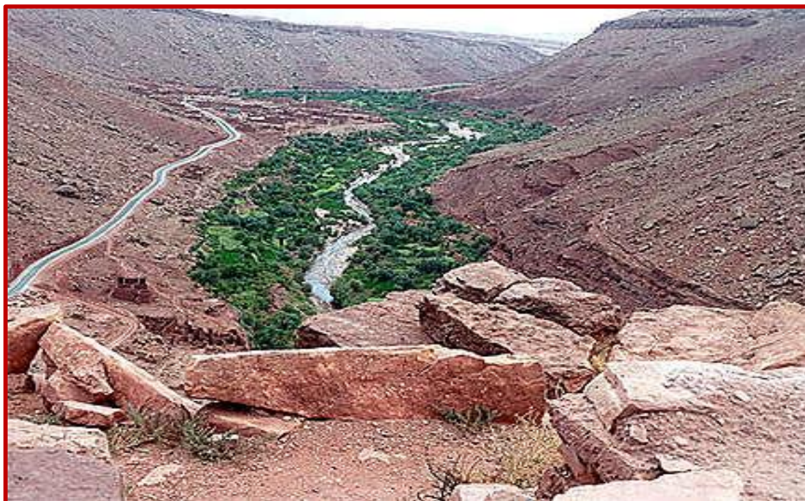
La vallée de l'OUNILA

Vous quittez AIT BEN HADDOU pour débiter votre étape par la remontée d'une piste tortillarde, récemment goudronnée, le long de la vallée de l'OUNILA afin de vous rendre à TELOUET où vous y découvrez l'ancienne Kasbah de résidence du guerrier « Thami el glaoui », le Pacha de MARRAKECH. Jusqu'à TELOUET, vous contemplez de nombreux et magnifiques petits villages en terre de couleur ocre qui se fondent parmi les reliefs montagnards déchiquetés. Vous traversez de nombreux vergers cultivés en terrasse, des ksour troglodytiques et des kasbahs à l'abandon.