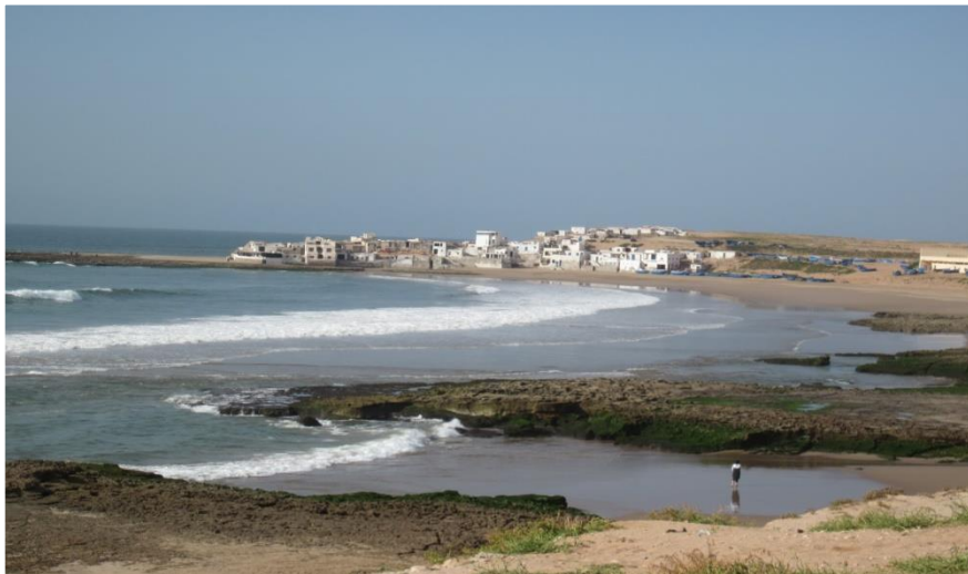
Village de Pêcheurs de TIFNIT

Dés 9 heures, après le petit déjeuner, vous prenez la direction du charmant petit village de pêcheur de TIFNIT. Après avoir consacré de nombreuses photos au charme de ce village, vous vous rendez à AGADIR, où vous accédez à la Citadelle historique, vous découvrez aussi le port de plaisance et sa superbe Marina, ainsi que la magnifique baie d'AGADIR, réputée comme l'une des plus belles du monde, avant de parcourir les avenues du centre ville Européanisé. A l'heure du repas de midi, vous êtes conduit dans un restaurant populaire du port de