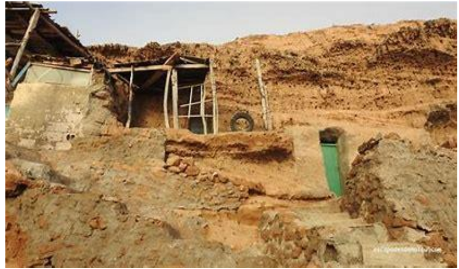
Grotte troglodyte de SIDI R'BAT

A 13 h 00, le repas de midi est pris sur la terrasse d'une authentique grotte troglodyte . Au menu « repas barbecue », en plus des grillades de poissons frais, pêchés le matin même. Vous êtes en pleine authenticité d'autant que votre hôte Brahim n'hésitera pas à vous faire visiter l'intérieur d'une grotte TROGLODYTE, à vocation d'habitation.