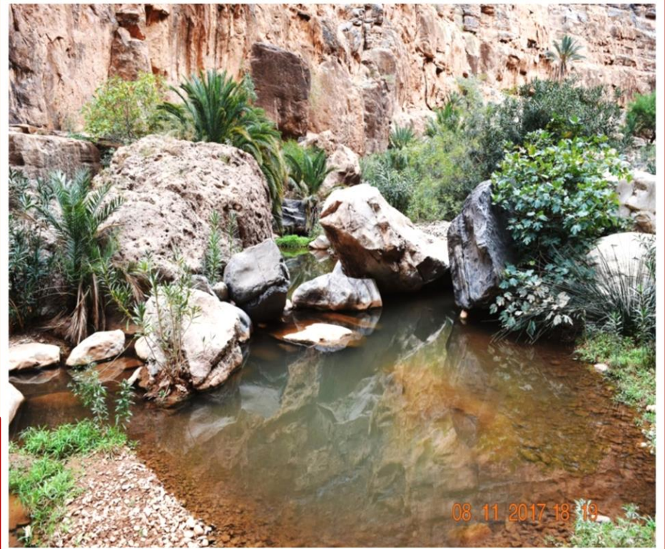
Oued alimentant l'oasis d'AMTOUDI

Envouté par cette oasis captivante, vous apprécieriez bien d'y rester davantage, mais l'heure avance et la route étant plus longue que large, vous regagnez le centre ALSEO « les dunes », pour prendre le repas du soir et y passer la nuit.