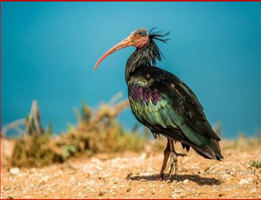
Ibis chauves (espèce en voie d'extinction)

Le Parc national du SOUSS MASSA est une véritable richesse ornithologique qui s'étend sur 33800 hectares et se trouve être le seul site au monde où l'on peut encore rencontrer, entre autres