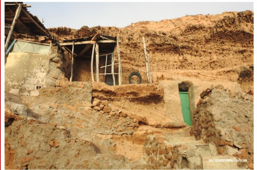
Grottes troglodytes de SIDI R'BAT

A l'origine du petit village de SIDI R'BAT, les pêcheurs attirés par l'abondance de poissons, abritaient leurs matériels et vivaient dans de nombreux habitats troglodytes encore intacts et parfois même, toujours utilisés à ce jour pour certains.