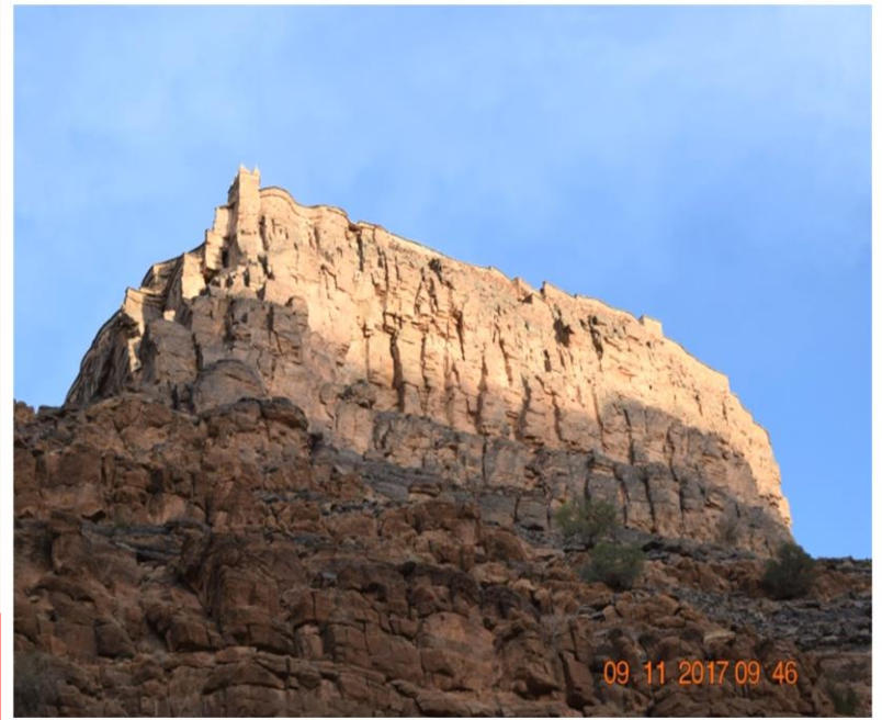
L'un des « agadir » d'Amtoudi

JOUR 3 : Après le « petit déjeuner » à 8 h 00, selon les conditions météorologiques, vous vous apprêtez à une grande excursion en direction de l'Anti Atlas qui, sous la conduite du guide ALSEO, vous mènera à AMTOUDI, magnifique oasis nichée dans le creux d'un canyon qui conserve deux magnifiques et authentiques Agadir (Agadir signifie « grenier » en berbère), auxquels vous pourrez accéder (à pieds ou à dos de mulets, selon votre choix).