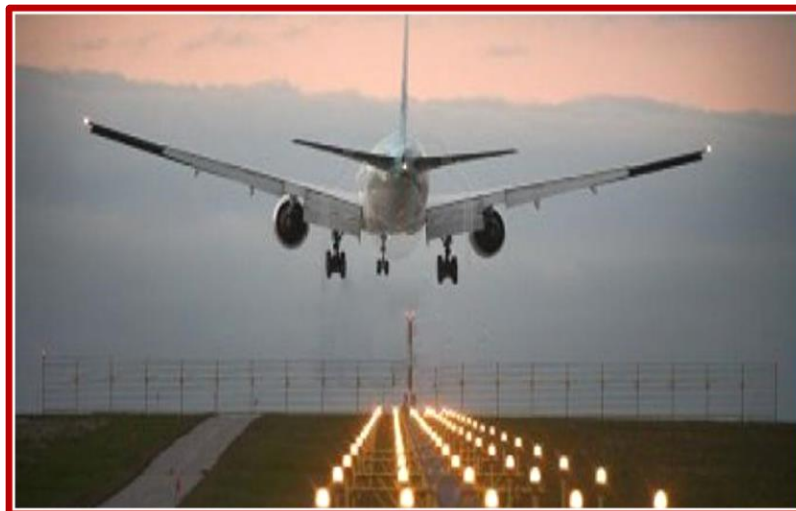
Arrivée à AGADIR

JOUR 1 : Au jour et à l'heure du début de séjour, les participants sont accueillis à l'aéroport d'AGADIR AL MASSIRA, par l'équipe d'encadrement d'ALSEO en charge du regroupement. Ils vous apportent l'aide et l'assistance dont vous pouvez avoir besoin, à votre arrivée, avant de vous conduire au bus ALSEO qui assure le transfert jusqu'au centre ALSEO des DUNES à SIDIR'BAT, situé à 60 Km au Sud d'AGADIR.