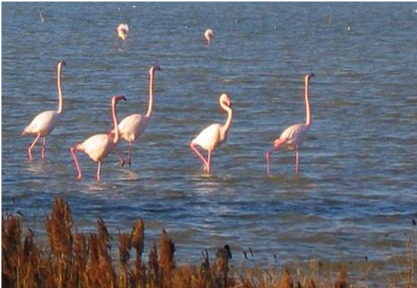
Parc National du SOUS MASSA

L'après-midi, vous choisissez entre du farniente sur la plage de 7 Km de SIDI R'BAT, ou vous rendre au parc national du SOUSS MASSA, avec le guide ALSEO, pour continuer de découvrir ces espaces naturels protégés, où la faune et la flore vous réservent de très agréables surprises, tout autant que vous saurez cultiver la patience et la discrétion. Le retour à LADUNE, se fait en fin d'après-midi, pour prendre le repas du soir !