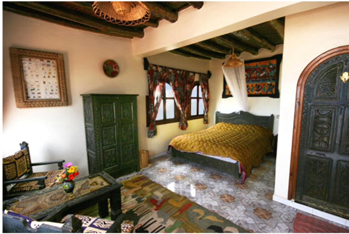
Chambre aux centre ALSEO des dunes de SIDI R'BAT

A l'origine du petit village de SIDI R'BAT, les pêcheurs attirés par l'abondance de poissons, abritaient leurs matériels et vivaient dans de nombreux habitats troglodytes encore intacts et parfois même, toujours utilisés à ce jour pour certains.