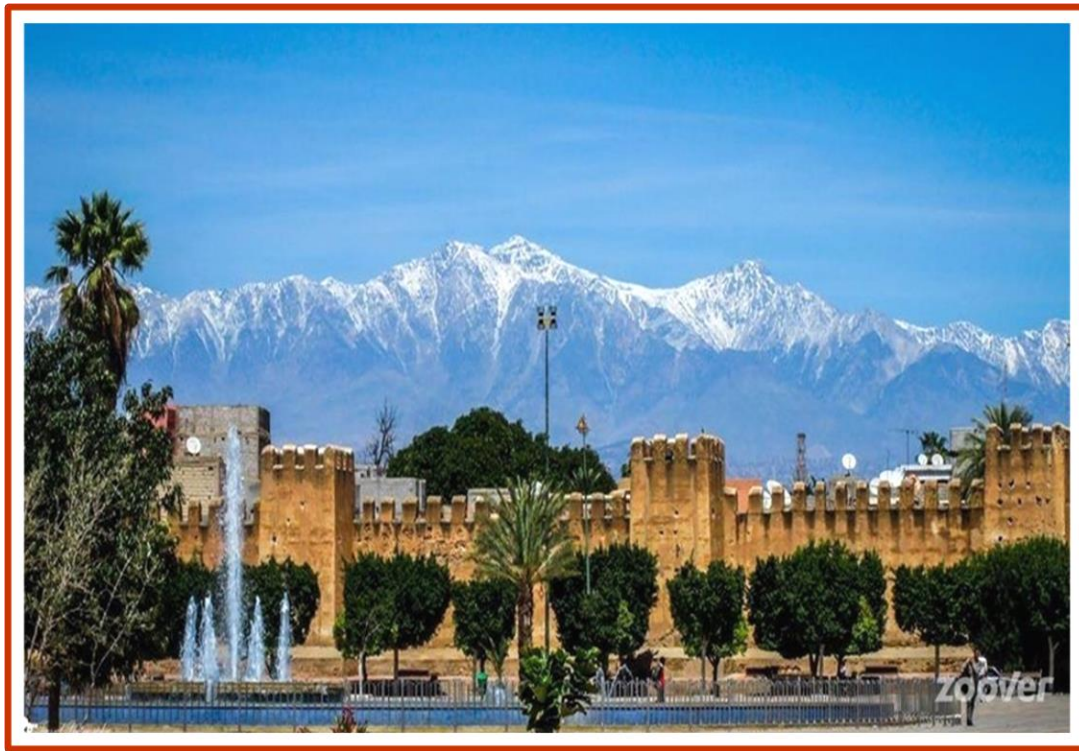
Ville de Taroudant

Caracolant autour des 6 Km de fortifications qui ceignent la ville historique vous découvrez les 130 tours et les 10 portes d'entrée, très anciennes, qui permettent d'accéder à la médina. Les fortifications de TAROUDANT sont rénovées régulièrement depuis 5 ans, les remparts ont retrouvé toute leur noblesse d'antan et continuent de dévoiler chaque jour leur magnifique couleur ocre au coucher du soleil.