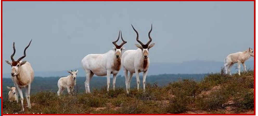
Parc National du SOUSS MASSA

JOUR 6 : A 9 h 00, après le petit déjeuner, le guide ALSEO vous emmène découvrir la profondeur du Parc national protégé du SOUSS MASSA .