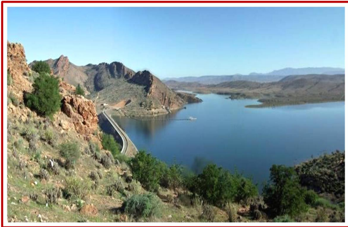
Barrage Youssef IBN TACHFINE