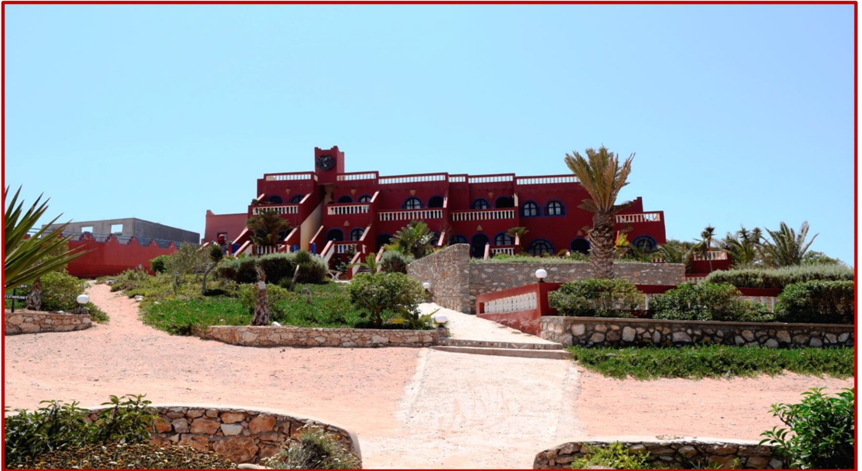
Hotel LA DUNE à SIDI R'BAT

A votre arrivée à SIDI R'BAT, petit village rempli d'un charme encore préservé du grand tourisme et situé sur les berges de l'oued MASSA, vous découvrez le centre ALSEO « LES DUNES » où vous résiderez durant votre séjour. Selon vos horaires d'arrivée, le repas vous est servi sous la tente caïdale, avant que vous ne preniez possession de la chambre qui vous sera attribuée, pour la durée du séjour.