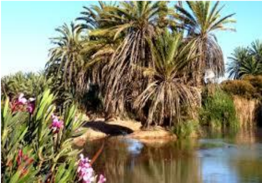
Oued alimentant l'oasis de TIGHMERT

JOUR 5 : A 7h30 petit déjeuner ! Puis c'est le CAP AU SUD ! Vous prenez la direction de GUELMIN pour vous rendre aux portes du désert de l'Ouest SAHARIEN, dans la plus grande et l'une des plus belles des oasis du Sud du Maroc « l'OASIS DE TIGHMERT ». Chemin faisant vous visitez la fameuse plage de LEGHZIRA, considérée comme l'une des plus belles du Maroc, avant de faire un tour de ville dans l'ancienne enclave Espagnole de SIDI IFNI et GUELMIN, capitale de la région GUELMIN OUED NOUN. A votre arrivée à TIGHMERT,