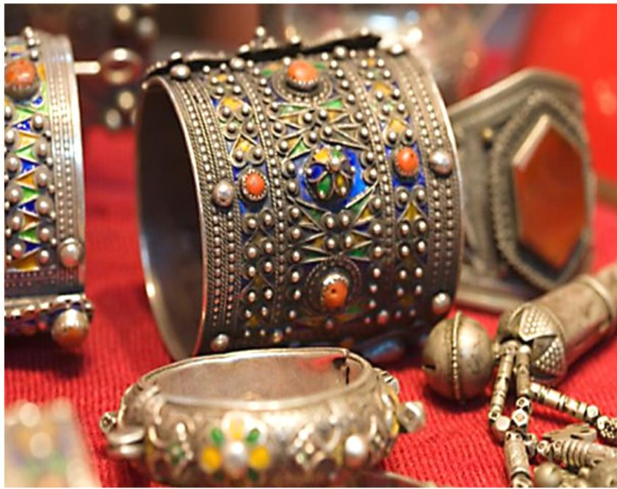
Argentiers de Tiznit

Après le repas de midi pris à LA DUNE, un guide ALSEO, vous propose la participation à une excursion de découverte de « la ville aux remparts » de TIZNIT. Vous visitez les fortifications surprenantes de TIZNIT, ses célèbres marchés aux légumes et aux poissons, la fontaine bleue, le guide vous entraîne aussi dans le quartier des argentiers de cette ville fortifiée, authentique, capitale du Maroc de la bijouterie d'argenterie. Le repas du soir est pris ensuite en commun à LA DUNE, avant d'y passer la nuit.