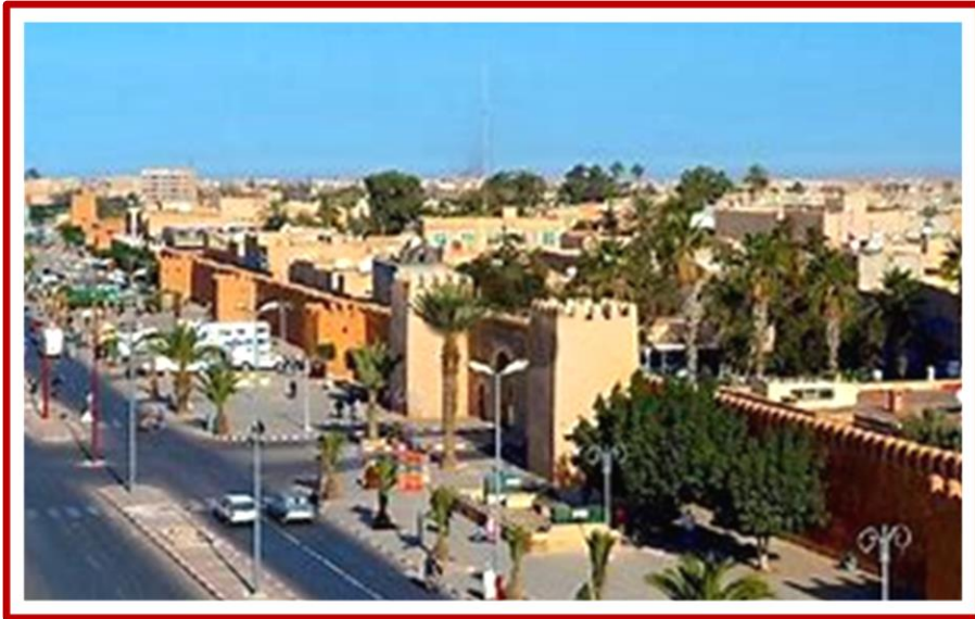
Ville de TIZNIT

JOUR 2 : Au terme de votre petit déjeuner, le groupe désigne en son sein, un jury chargé du contrôle des modalités d'applications d'un règlement à convenir, concernant les conditions d'un « concours photos ». Les possesseurs de tous modèles d'appareils photos peuvent participer, de même que le sous-groupe définira ses propres thèmes et règlements du concours, dont la durée s'échelonnera entre les jours 2 et 7 du séjour.