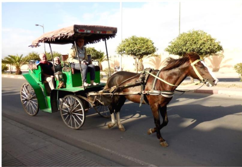
Promenade en calèche à Taroudant