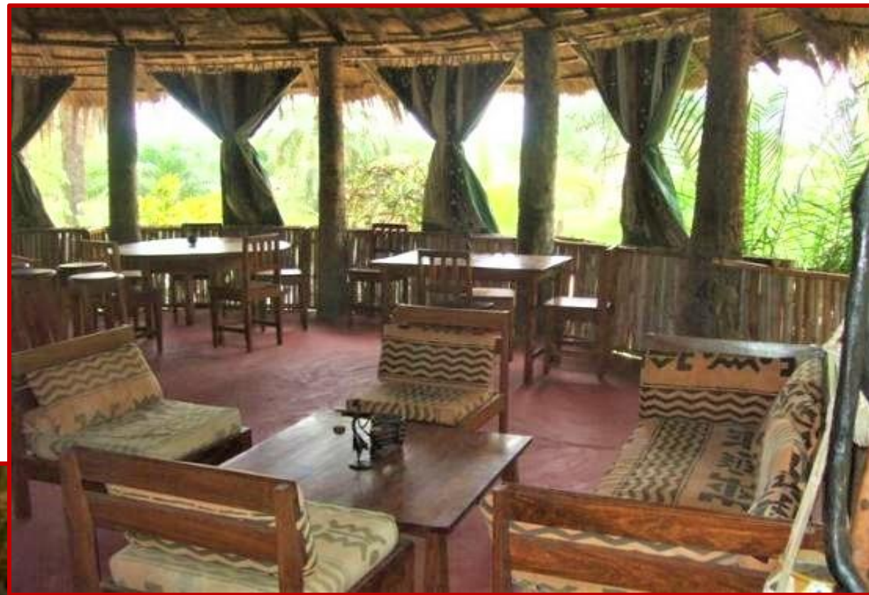
Restaurant de l'ESPERANTO LODGE