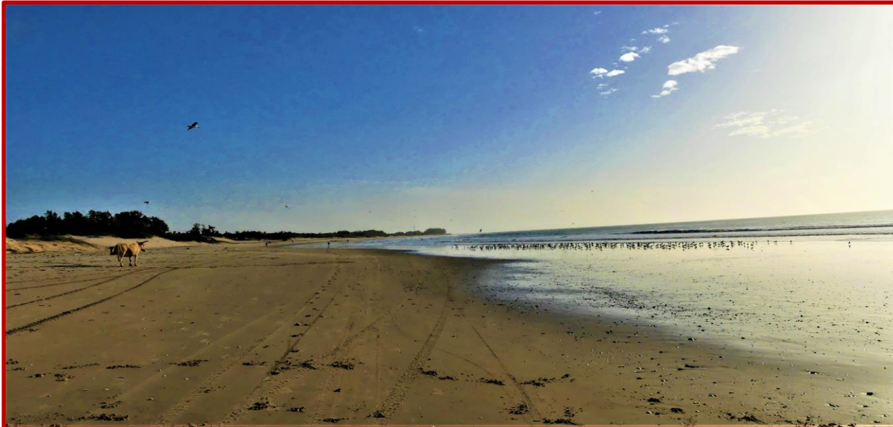
Des plages interminables.....

La zone de pêche de votre séjour reste toujours praticable dans les bolongs des mangroves, quelle que soit la météo ; pour capturer de magnifiques poissons, des plus diversifiés, selon plusieurs techniques de pêche en bateau , mais surtout des carnassiers d'une formidable vivacité : La carangue, le barracudas, le capitaine et la carpe rouge qui sont de fantastiques combattants, vous attendent.