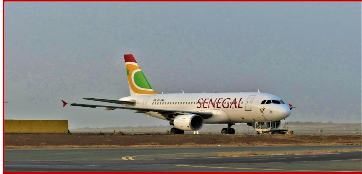
Liaison aérienne Marseille - DAKAR