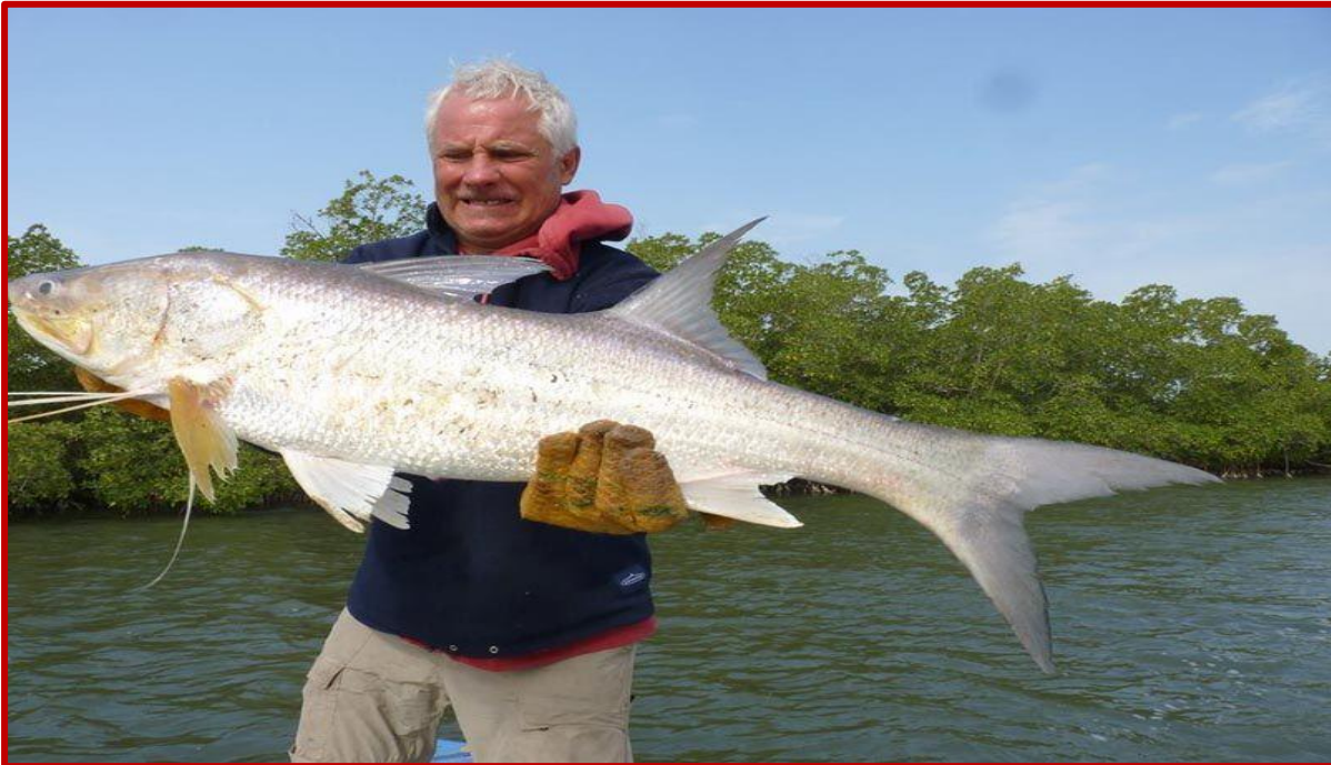
Prise dans les bolongs

Le piquenique de midi se prend à bord (pas de temps à perdre...)