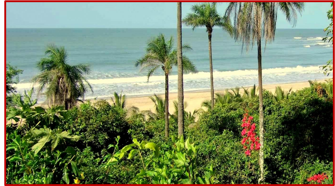
Des plages d'exceptions