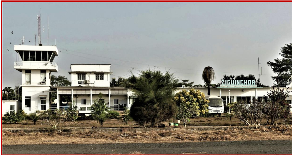
Petit aéroport de ZIGUINCHOR