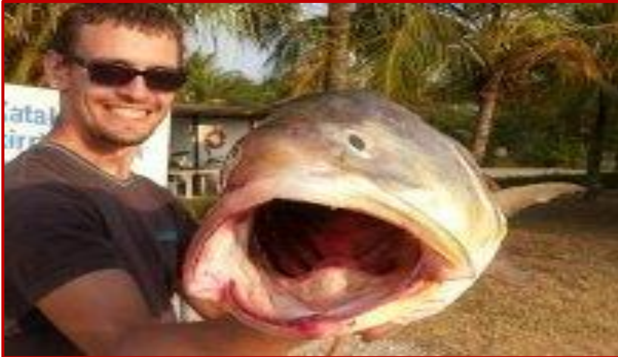
De très nombreux et beaux poissons dans les bolongs