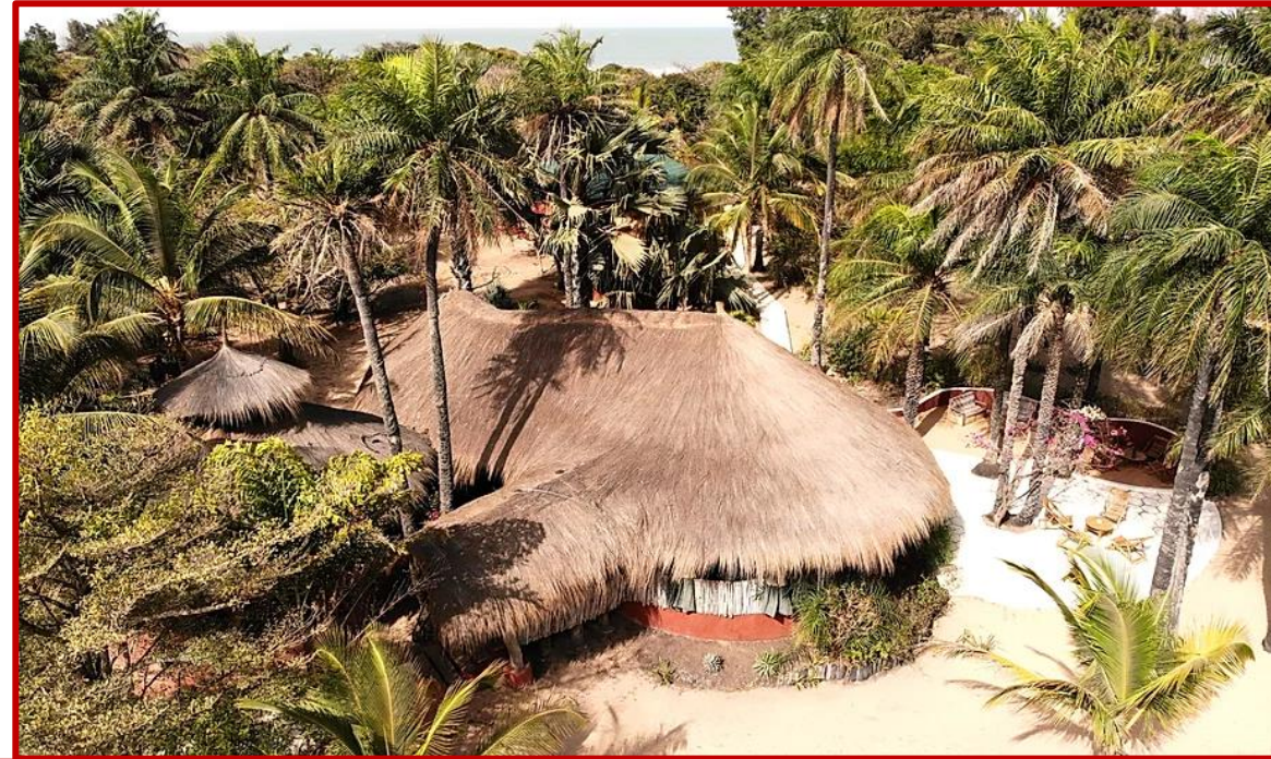
Bienvenue au lodge (Salle de restaurant)