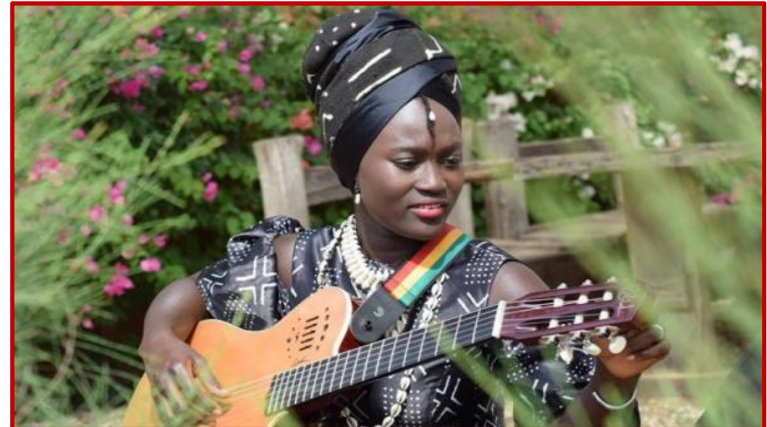
Les femmes CASAMANCAISES