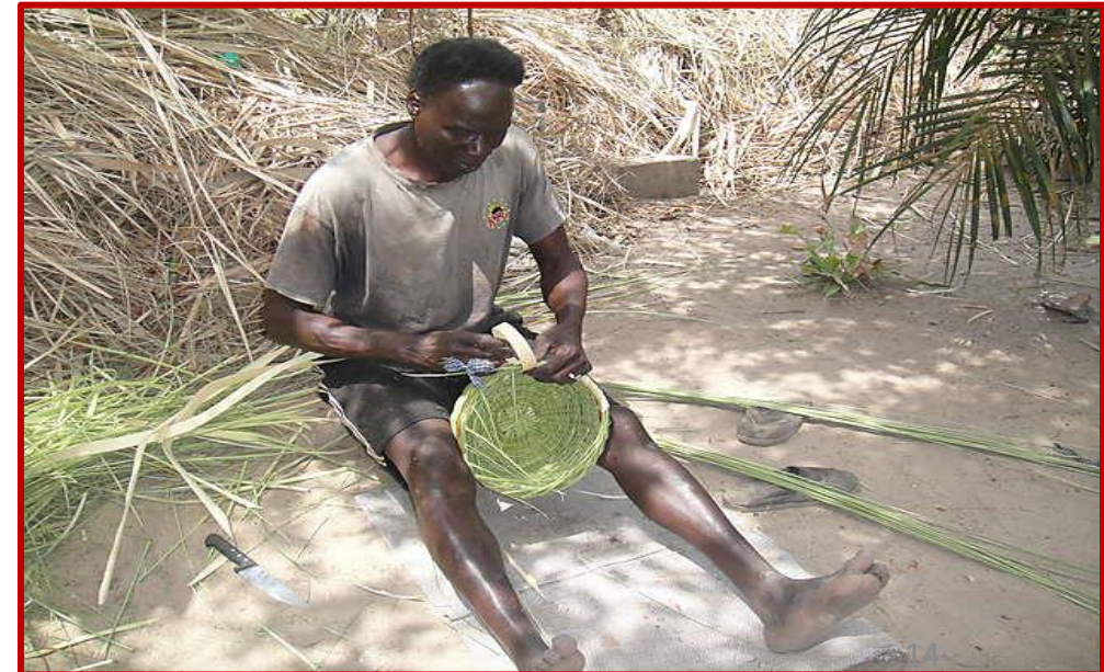
Métier de l'osier