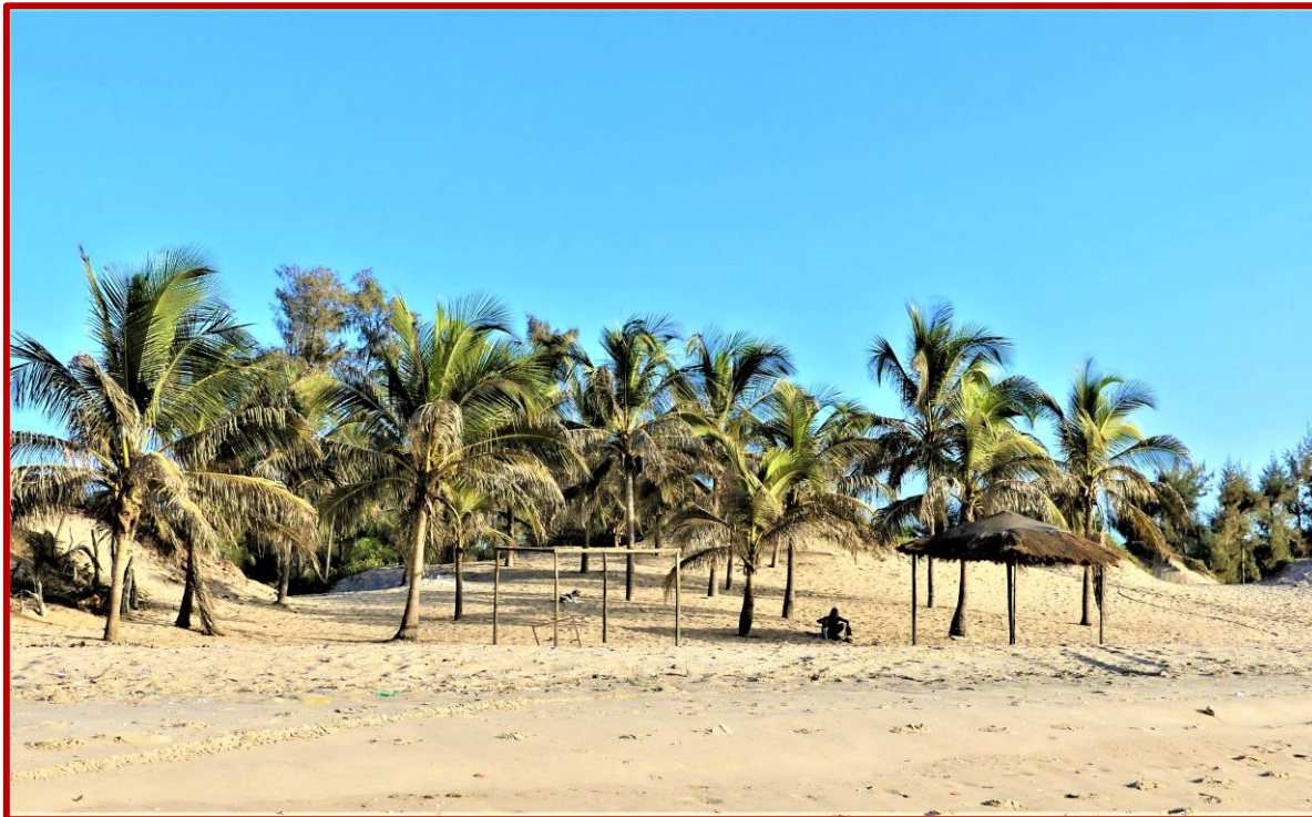
Plage personnalisée du lodge ESPERANTO