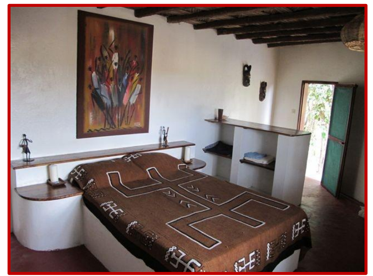
Chambre dans les cases au lodge