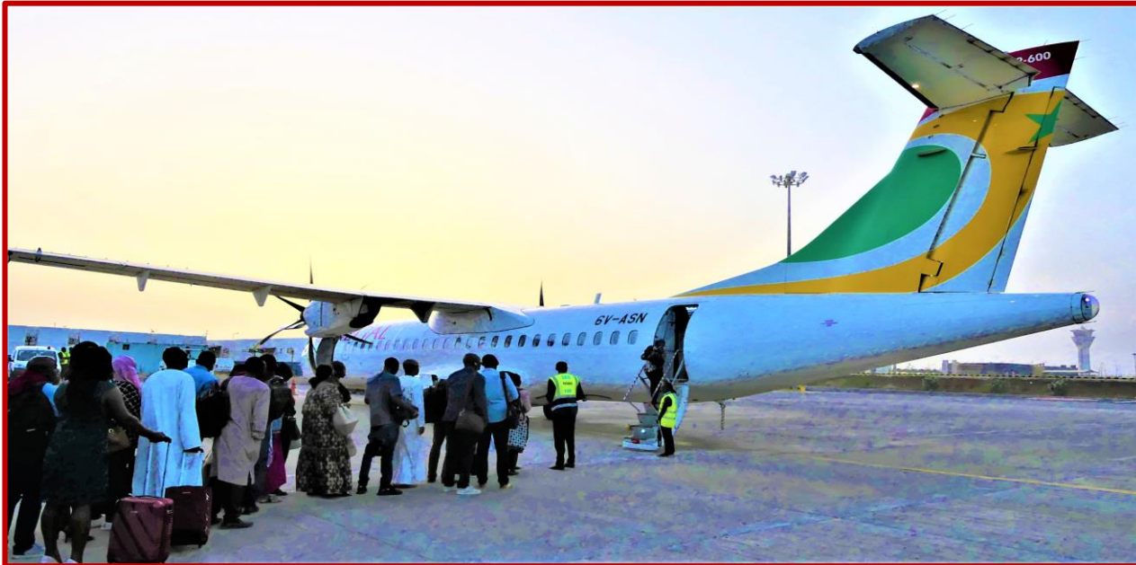
Le chemin du retour !