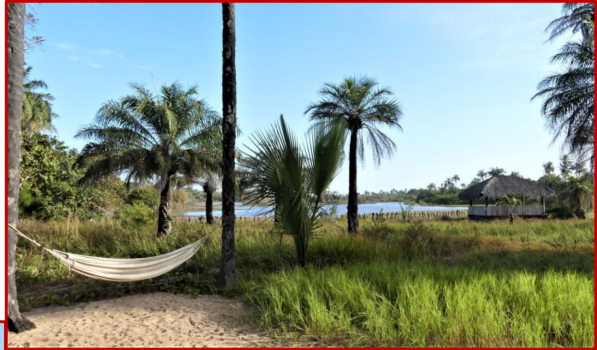
Depuis la salle à manger du lodge, dernier regard sur ses environs...