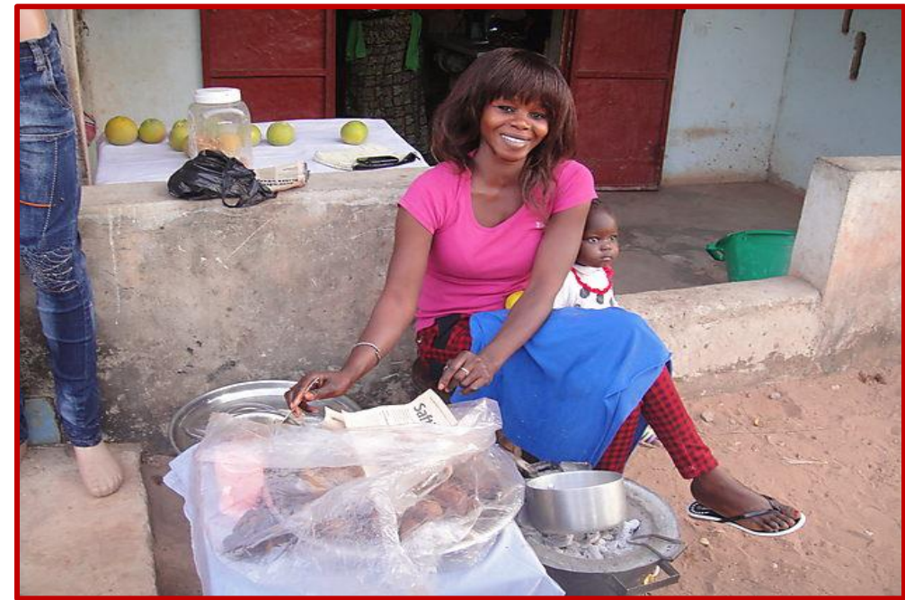
La vendeuse de beignets de KAFOUNTINE