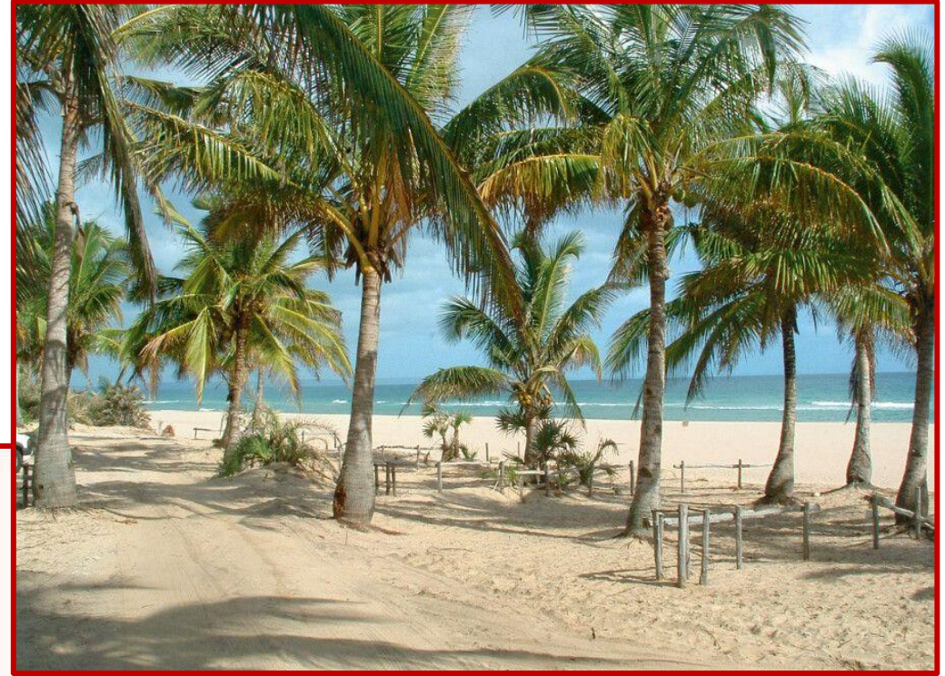
Plage de KAFOUTINE