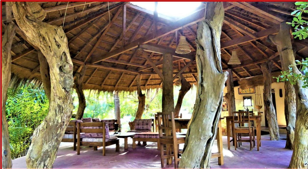
Salon du lodge