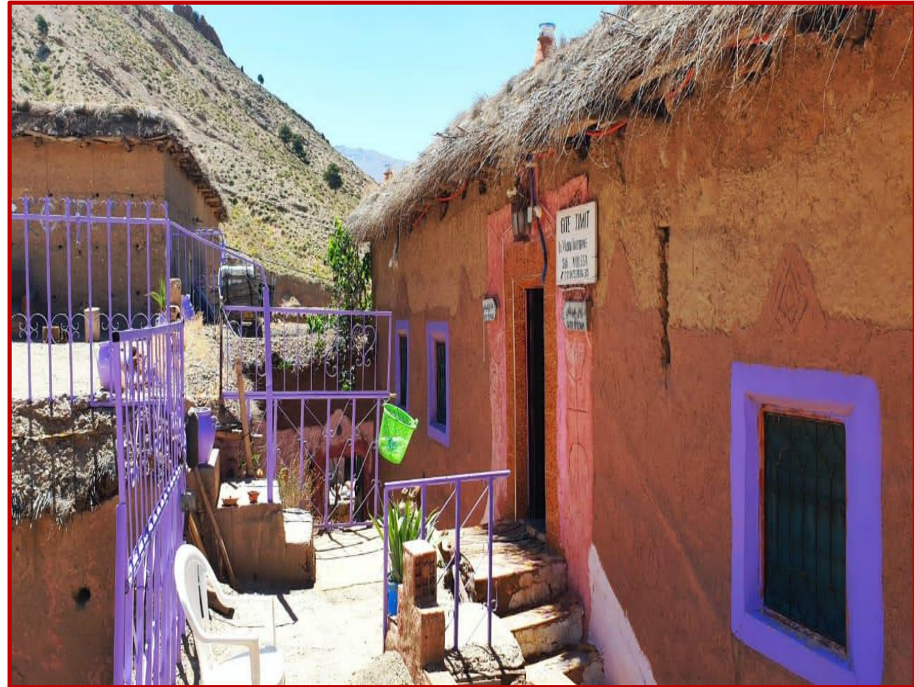
Gîte la maison Imazighne à TIMMIT