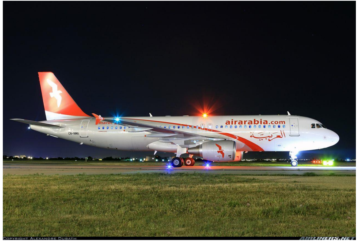
VOL POUR MARRAKECH

Le soir le repas est pris en commun à l'hôtel. Après le repas vous pourrez choisir de vous coucher tôt ou, si vous le désirez, aller vous promener dans les environs de l'hôtel où vous trouverez de l'animation.