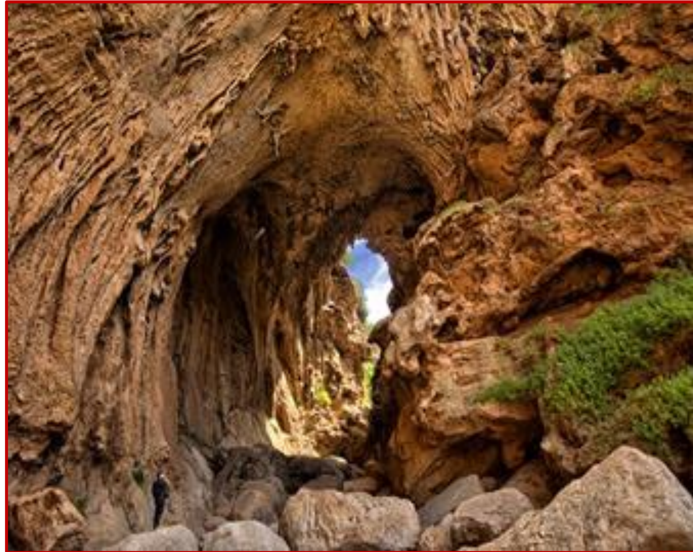
Pont naturel d'IMI N'IFRI

Le petit déjeuner est pris au gîte et, comme un trait d'union entre ce séjour et votre retour à l'urbanisation, vous entreprenez la dernière étape pédestre, pour une durée de 3 heures, afin de traverser le village d'AÏT ALLA et parvenir au village de FAKHOUR, où vous prenez le dernier repas de midi au bivouac avec votre guide. Il sera temps alors de transborder les bagages dans le minibus qui vous attend et oui, c'est aussi l'heure des aurevoirs, vous allez quitter le guide, le chef de cuisine, les accompagnants et leurs mules qui se sont donnés sans compter, pour que le souvenir de cette rando reste à jamais gravé dans votre mémoire.... Sur le chemin du retour à MARRAKECH, vous visitez la curiosité du pont naturel d'IMI N'IFRI. En fin d'après midi vous arrivez à l'hôtel à MARRAKECH, où l'accompagnant ALSEO recense vos horaires de convocations pour l'enregistrement à l'aéroport, afin d'organiser les navettes de transfert pour le lendemain matin.