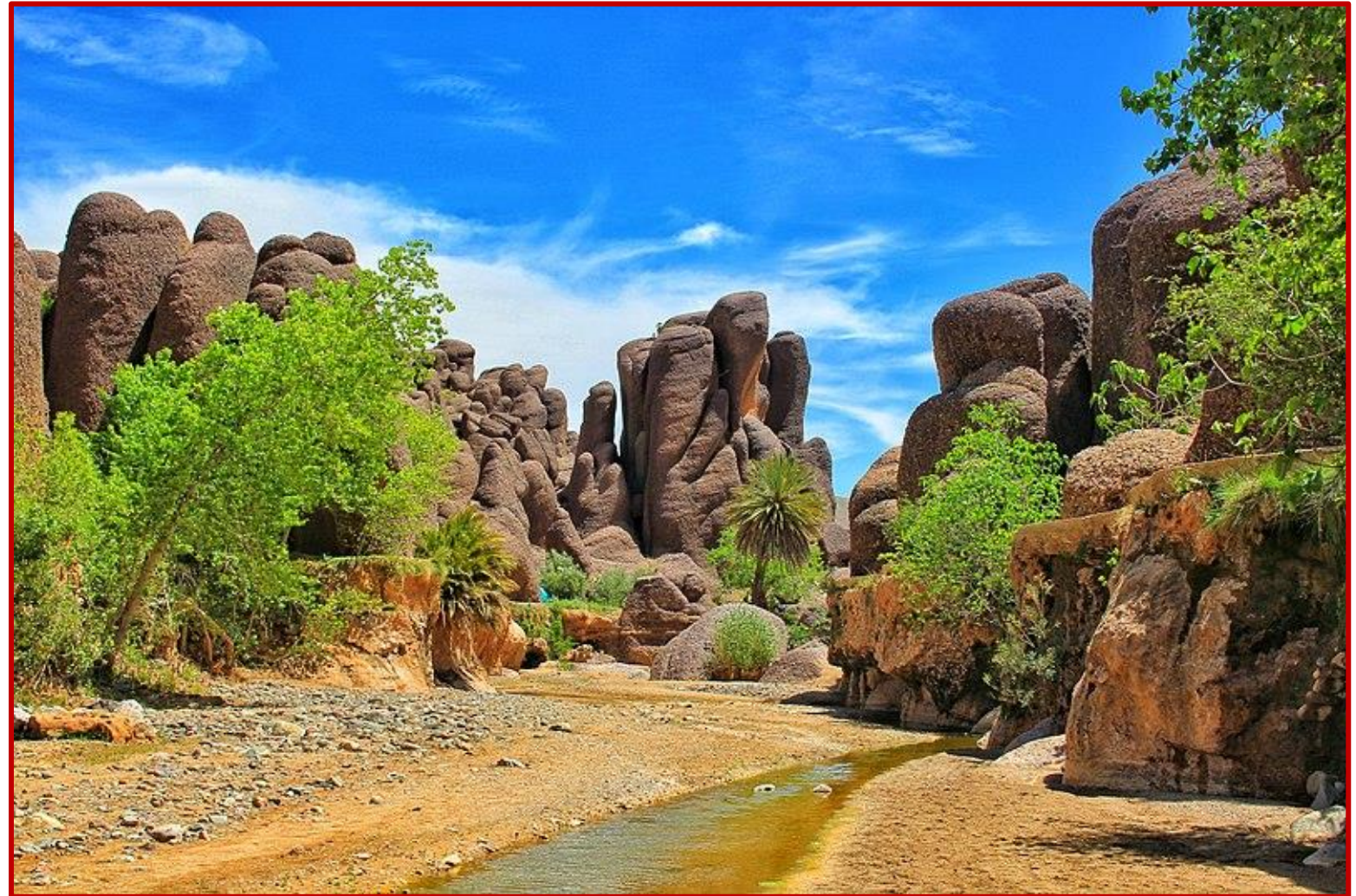
Gorges de TISLIT au milieu de paysages surprenants

Après le petit déjeuner, vous progressez dans la verdoyante vallée des AÏT MAAROUF qui vous permet d'atteindre un exceptionnel grenier troglodyte dans le petit village de TIZGUI, accroché au flanc rocheux d'une puissante montagne. Vous poursuivez votre parcours en traversant de petits douars entourés de jardins où les villageois ne manquent pas de vous témoigner leur plaisir à vous rencontrer et tenter de prendre langue avec vous. Pour clore votre étape journalière vous parvenez dans les petites gorges d'un oued serpentant entre des blocs de rochers cyclopéens, au milieu d'arbustes colorés et quelques palmiers isolés, qui constituent une vraie petite Merveille et vous conduisent aux pieds du village de TISLIT où vous prenez le repas et vous passez la nuit dans le gîte de Khadigea et Ahmed, cultivateurs de Safran !