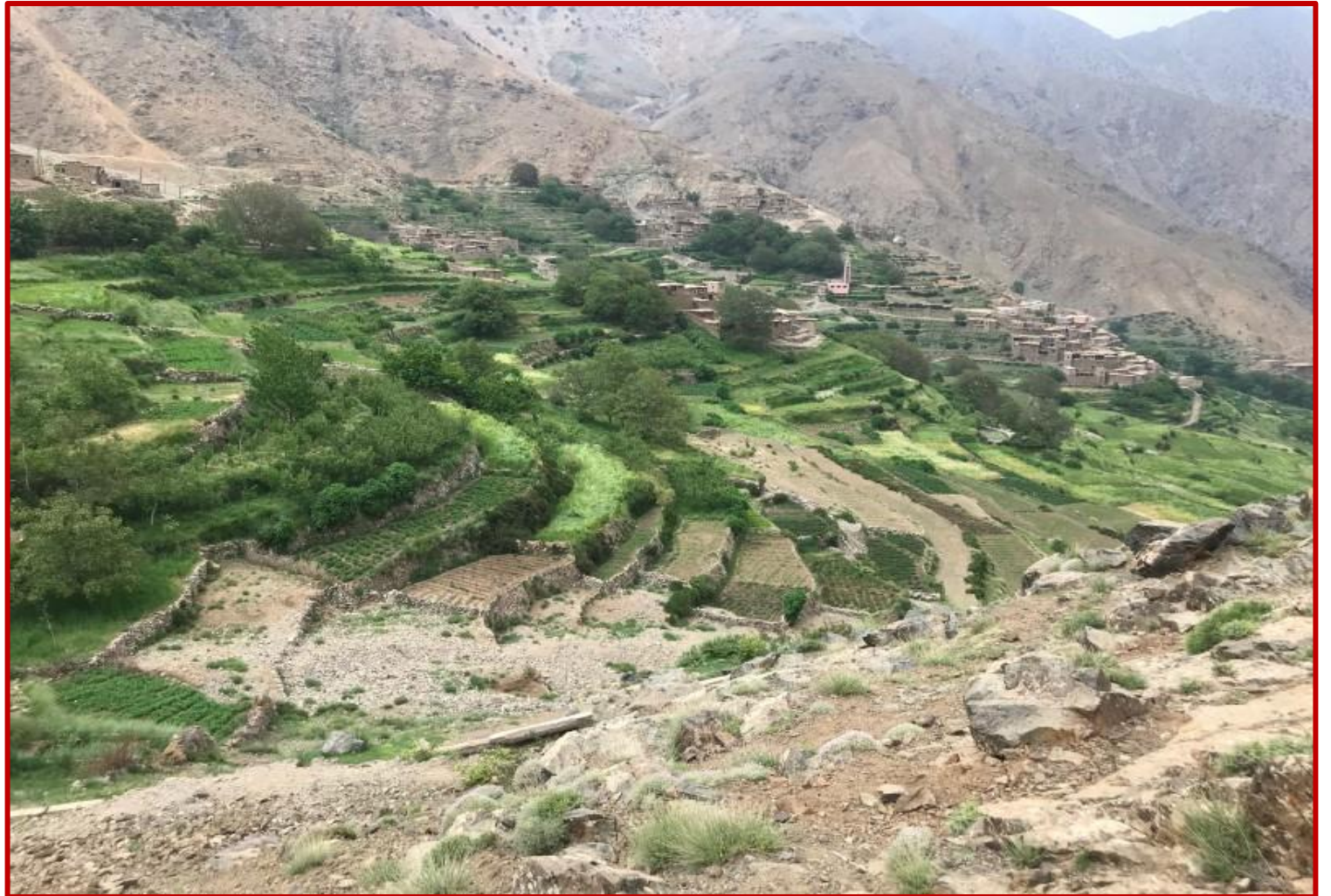
Cultures en terrasses

Après un petit déjeuner profitable pour entreprendre une journée d'ascension, vous gagnez les hauteurs des espaces pastoraux d'estive où vous ne pourrez pas éviter de penser à l'énergie qui aura été nécessaire au fil des temps, pour créer les remarquables terrasses de plantations de Safran qui s'offrent à vos yeux. Vous prenez le repas de midi sur les immenses pelouses naturelles en admirant le Jebel GUELIZ. Vous reprenez ensuite l'ascension en progressant dans un canyon où se logent les grottes de TEGRAGRA, pour atteindre des bergeries d'altitude (Azib en berbère), sises dans de jolies plantations en terrasses, où les bergers berbères de la tribu des Beni M'ZGUID, montent au début du printemps pour labourer et semer l'orge, afin d'y revenir en été, pour les moissons. Vous regagnerez votre bivouac en fin d'après midi pour une nuitée méritée.