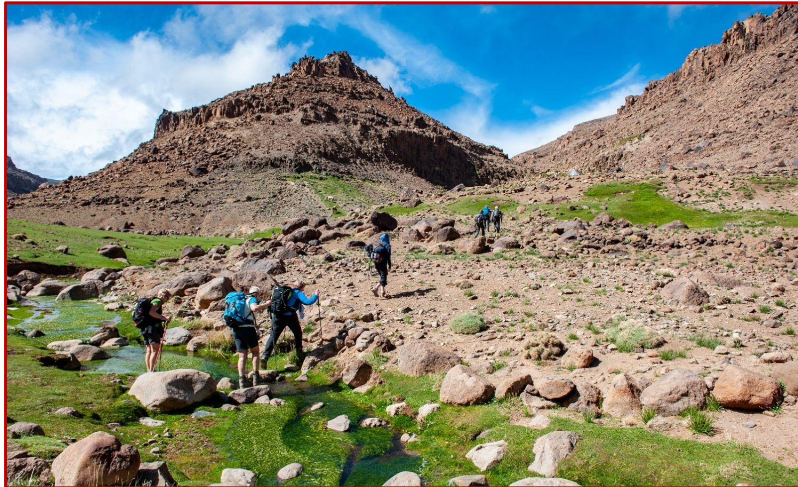
Le long des ruisseaux pour achever la randonnée du SIROUA

Après le petit déjeuner, vous choisissez de faire une balade en boucle dans ces si surprenantes gorges de TISLIT, ou de vous reposer au village en vous rendant chez l'habitant visiter ses fabrications de tapis artisanales réputées. Le repas pris au gîte, vous entreprenez une petite marche qui vous permettra de regagner votre point de départ de TAGMOUT . Chemin faisant, vous dépassez le village d'ASSAÏSSE, puis d'AÏT ICHT, avant d'emprunter un beau sentier, dominant d'étonnantes terrasses cultivées, qui vous conduit aux petites gorges de l'assif N'TALMACHACT. Puis les paysages se font plus minéraux jusqu'au terme de votre randonnée dans l'assif AÏT OUAMRANE de TAGMOUT où vous prenez votre repas du soir et passez la nuit dans le gîte de votre départ.