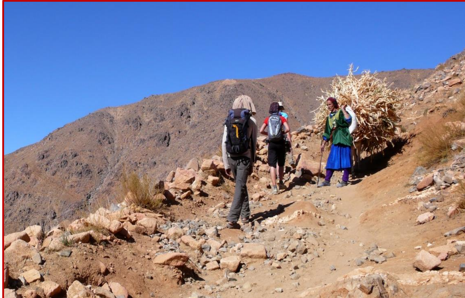
Toujours plus haut vers le sommet

Après le petit déjeuner, le guide vous présente vos accompagnants, avec lesquels vous chargez les mules qui porteront vos bagages, tout au long de cette randonnée. Vous débuterez votre étape par la rive gauche de l'oued en remontant la vallée pour atteindre un col au pieds du jbel TAOUYALT. Vous basculerez ensuite dans univers minéral dépendant du territoire des AÏT SAADEN. Vous traversez les petits villages de TACHKENT et de DAR IMLIL, où vous découvrirez le savoir faire ancestral des artisans au « village des forgerons » de la tribu des AÏT SAADEN. Après le repas de midi, vous prenez la direction de votre campement du soir que vos accompagnants vous auront installé sur une terrasse proche du village. Vous voilà rendu au bivouac où vous prenez le repas cuisiné du soir, en commun, avant de gagner votre tente et y passer la nuit.