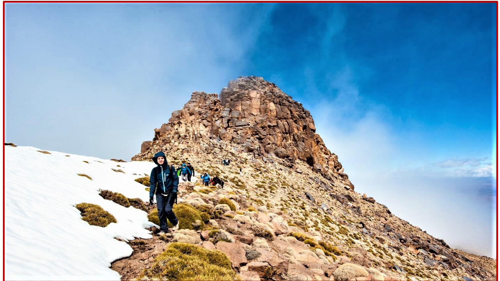
Le sommet du djebel SIROUA.....

Après le petit déjeuner vous allez faire face « au jour le plus haut »....! Ceux des moins aguerris du groupe pourront opter pour un passage par un col leur évitant l'ascension du sommet du djebel SIROUA. Avec les plus courageux, dans un paysage minéral de roches arrondies, vous choisirez d'entreprendre l'ascension du djebel SIROUA (3304 m) qui ne présente pas vraiment de difficultés. Ceux désirant poursuivre, sans passer par la case sommet, se rendant d'une vallée à l'autre par un col simple à passer. En cas de pluie, votre groupe de marcheurs ne bivouaquera pas, mais il prendra son repas du soir et passera la nuit dans un gîte à TIZGUI.