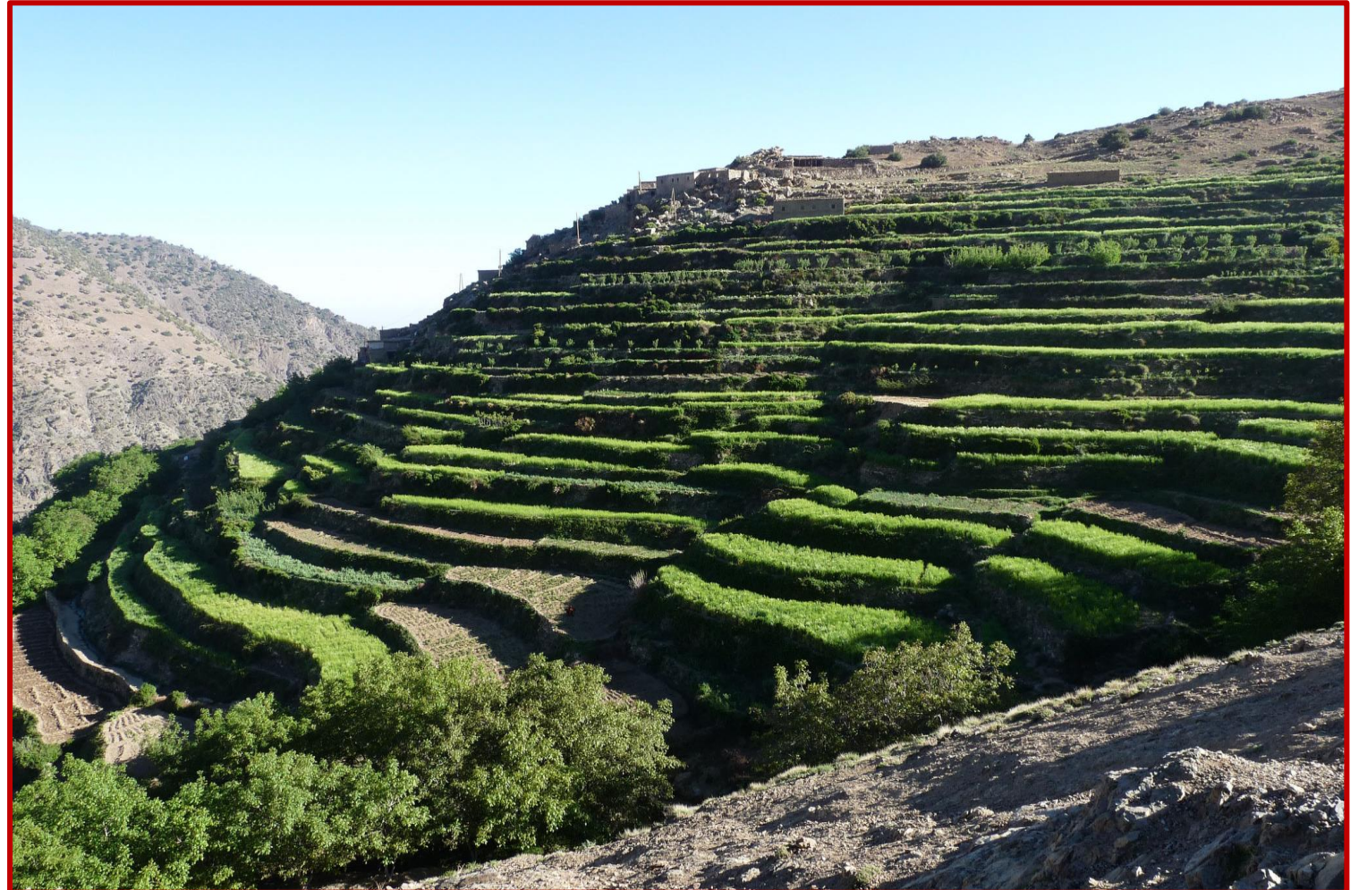
Terrasses cultivées au TOUBKAL

A 8 h, après votre petit déjeuner, le minibus ALSEO vous transfère à travers des vallées verdoyantes et de jolis villages berbères, dans la vallée d'IMLIL, à IMI OUGHLAD, point de rendez vous avec votre guide - son équipe accompagnante constituée du cuisinier, des muletiers et leurs animaux. Le chargement des mules effectué, votre Trek débute par un sentier serpentant entre des forêts de thuyas et de genévriers odorants, jaillissant d'une terre étonnement rouge. Vous parvenez au col de TIZI N'TACHT (1998 m) où vous appréciez la vue panoramique sur les vallées adjacentes d'AÏT MIZANE et d'AZZADEN, vers où vous vous rendez, dépassant de petits villages berbères rivalisant d'originalité et d'authenticité. La soirée venue, vous appréciez l'ambiance accueillante du gîte d'ID AISSA.