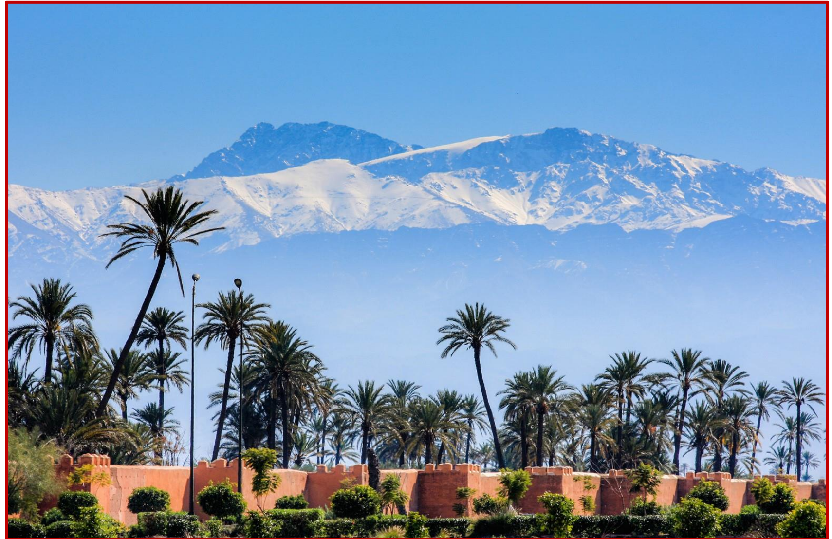
TOUBKAL depuis MARRAKECH

Les accompagnants d'ALSEO regroupent les marcheurs pour vous conduire dans le minibus et prendre la direction du centre ville de MARRAKECH, où dès la répartition des chambres terminée, vous optez soit pour vous rendre à titre personnel au jardin MAJORELLE ou à la place JEMAA EL F'NAH tout proches, soit pour prendre un bain dans la piscine de l'hôtel, avant le repas du soir en commun. Il sera alors temps que vous regagniez votre chambre pour une nuit de repos bien méritée.