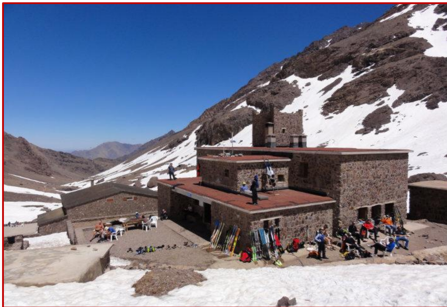
Refuge NETLER du TOUBKAL

Après le petit déjeuner, vous prenez rapidement de l'altitude en empruntant un sentier zigzagant pour gagner la crête du djbel AGUELMIZ (3650 m), où vos efforts se trouveront récompensés par une vue « grand format » sur la magnifique chaîne montagneuse du TOUBKAL qui s'offre à vous. Les participants les moins aguerris du groupe peuvent éviter l'ascension du sommet du djbel AGUELMIZ. Il est temps d'entreprendre la descente vers le refuge NETLER du TOUBKAL, en empruntant un sentier muletier ancestral, parfois empierré qui surplombe la vallée. Au cas où l'enneigement nécessite un changement de l'itinéraire, celui-ci vous serait communiqué par le guide. Après le repas pris au refuge vous regagnez le dortoir pour y passer une partie de la nuit.